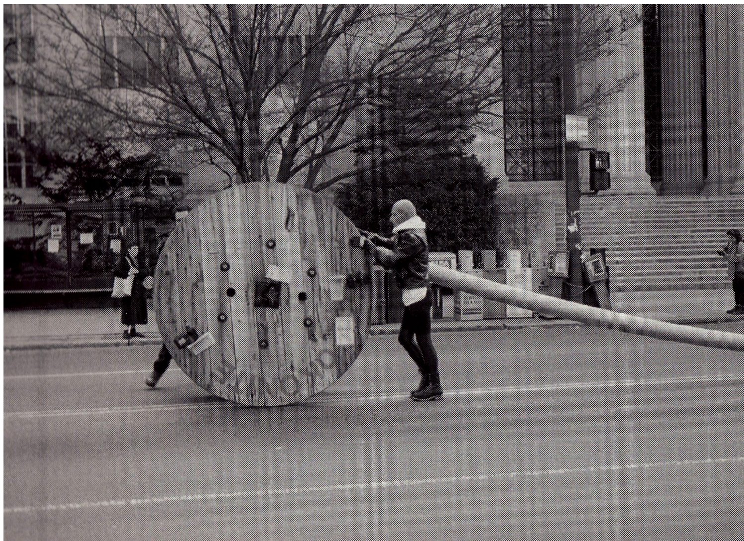
Δυο τελευταίες εικόνες: «Ο Δημιουργός και το ξετύλιγμα του αιγιματικού μύθου του Έργου»