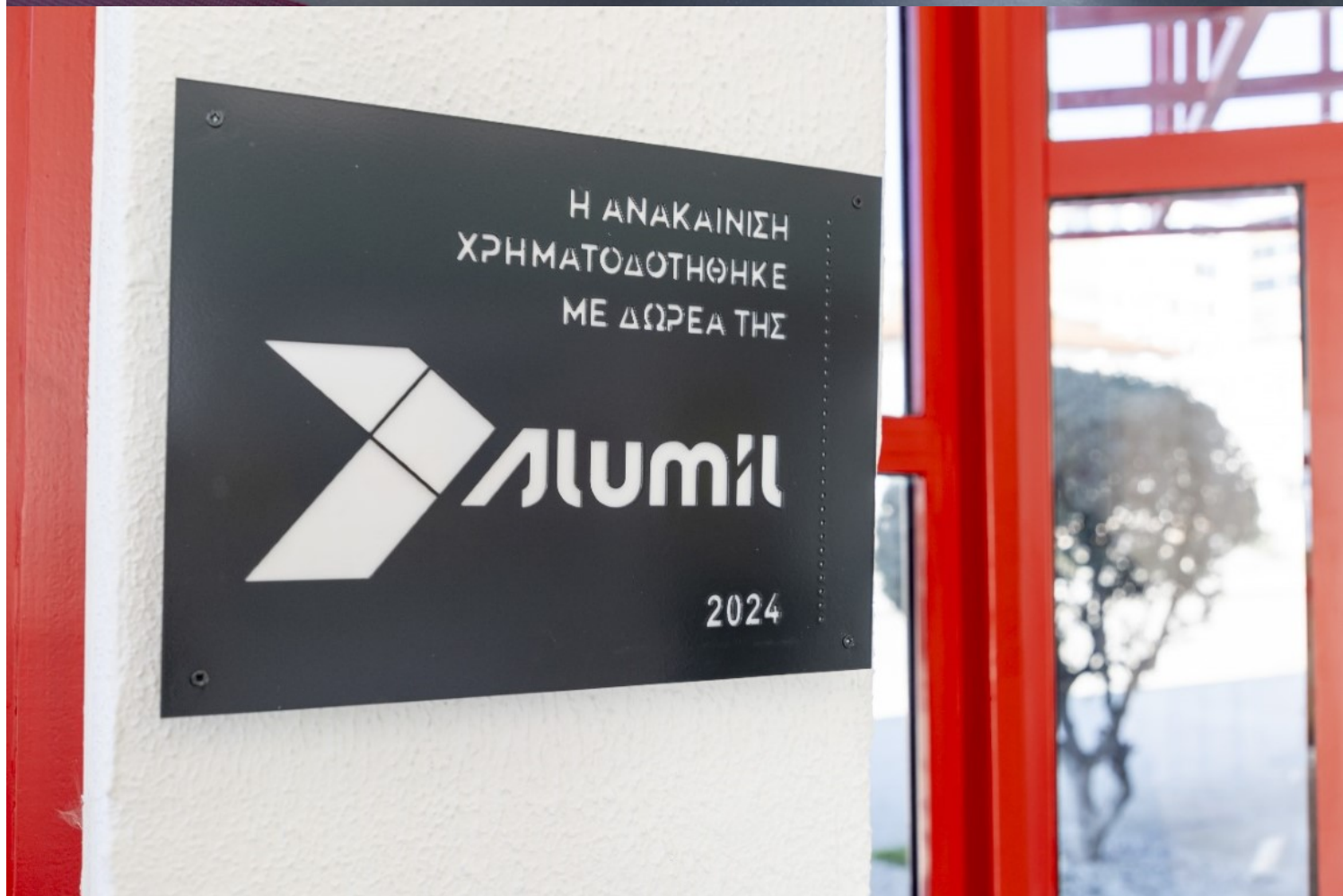
Τα παιδικά χαμόγελα επέστρεψαν στον βρεφονηπιακό σταθμό στην Α' προβλήτα του λιμανιού Θεσσαλονίκης μετά από πολλά χρόνια. Με τα εγκαινία που έγιναν σηματοδοτήθηκε η επίσημη