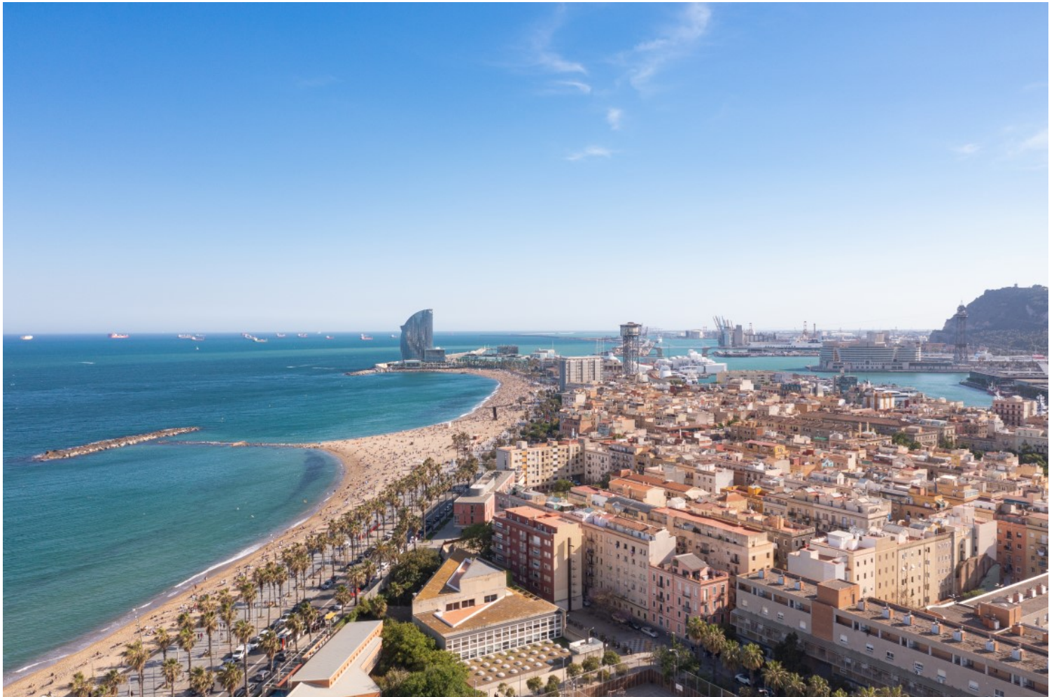
Aerial view of Barceloneta Beach and Port Vell in Barcelona, Spain

Η θετική αξία του χώρου γενικότερα αποδίδεται στα κοινωνικά δρώμενα, καθιστώντας τον δέκτη Κοινωνικού Πολιτισμικού Κεφαλαίου (Χτούρης Σωτήρης Ν., 2005). Συγκρίνοντας το παρόν με το παρελθόν,