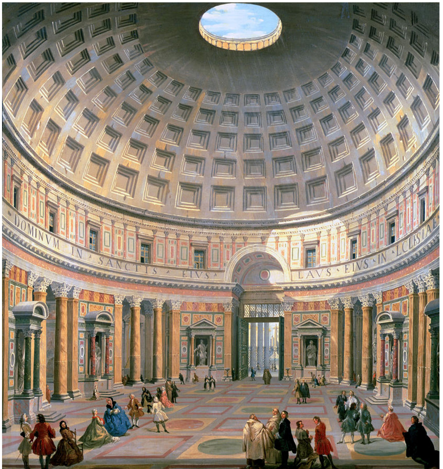
Εικόνα 3. Giovanni Paolo Panini, Πάνθεον, 1734