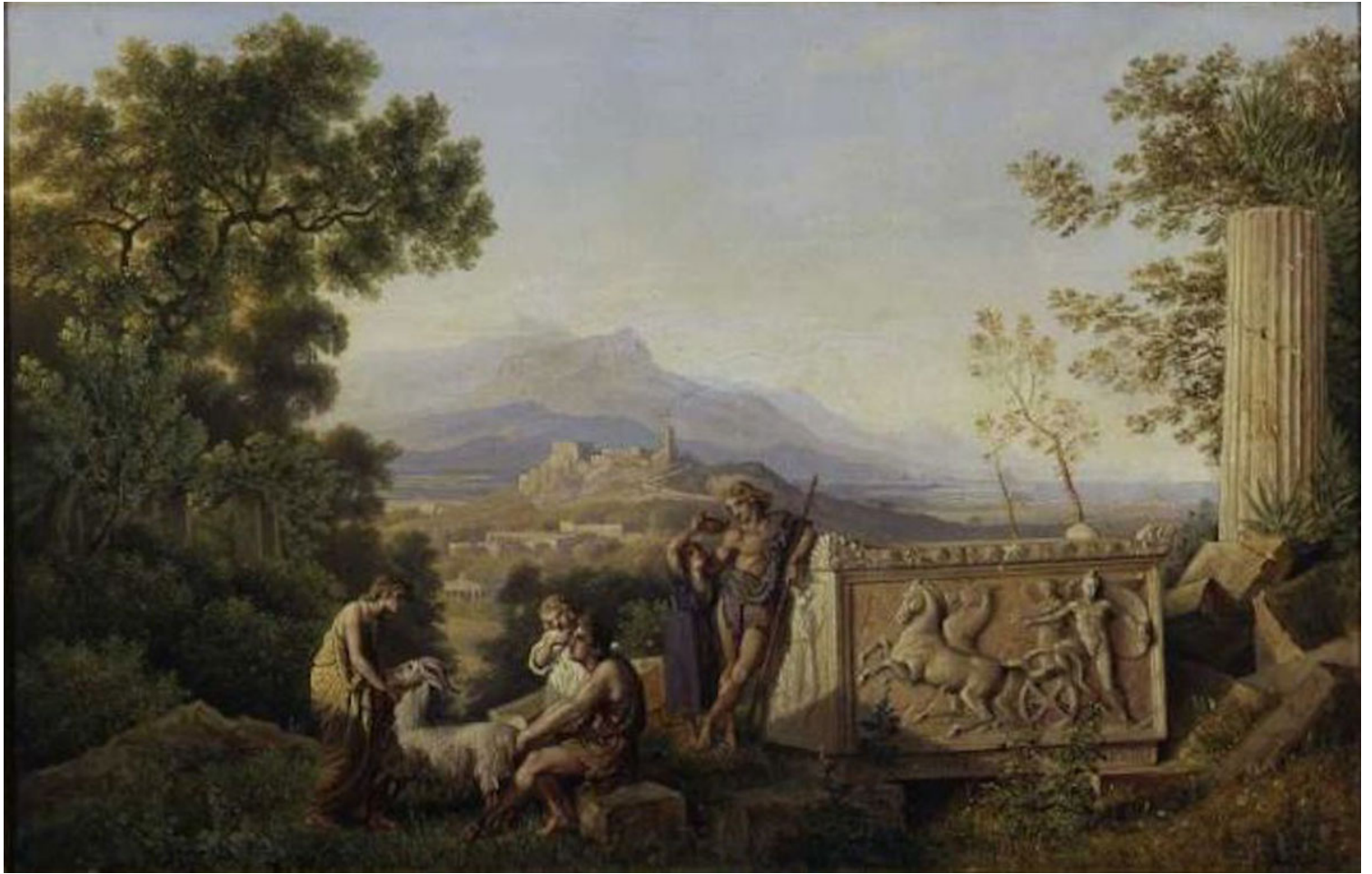
Εικόνα 5. Karl Friedrich Schinkel, Ελληνικό ιδανικό τοπίο με βοσκούς, 1823