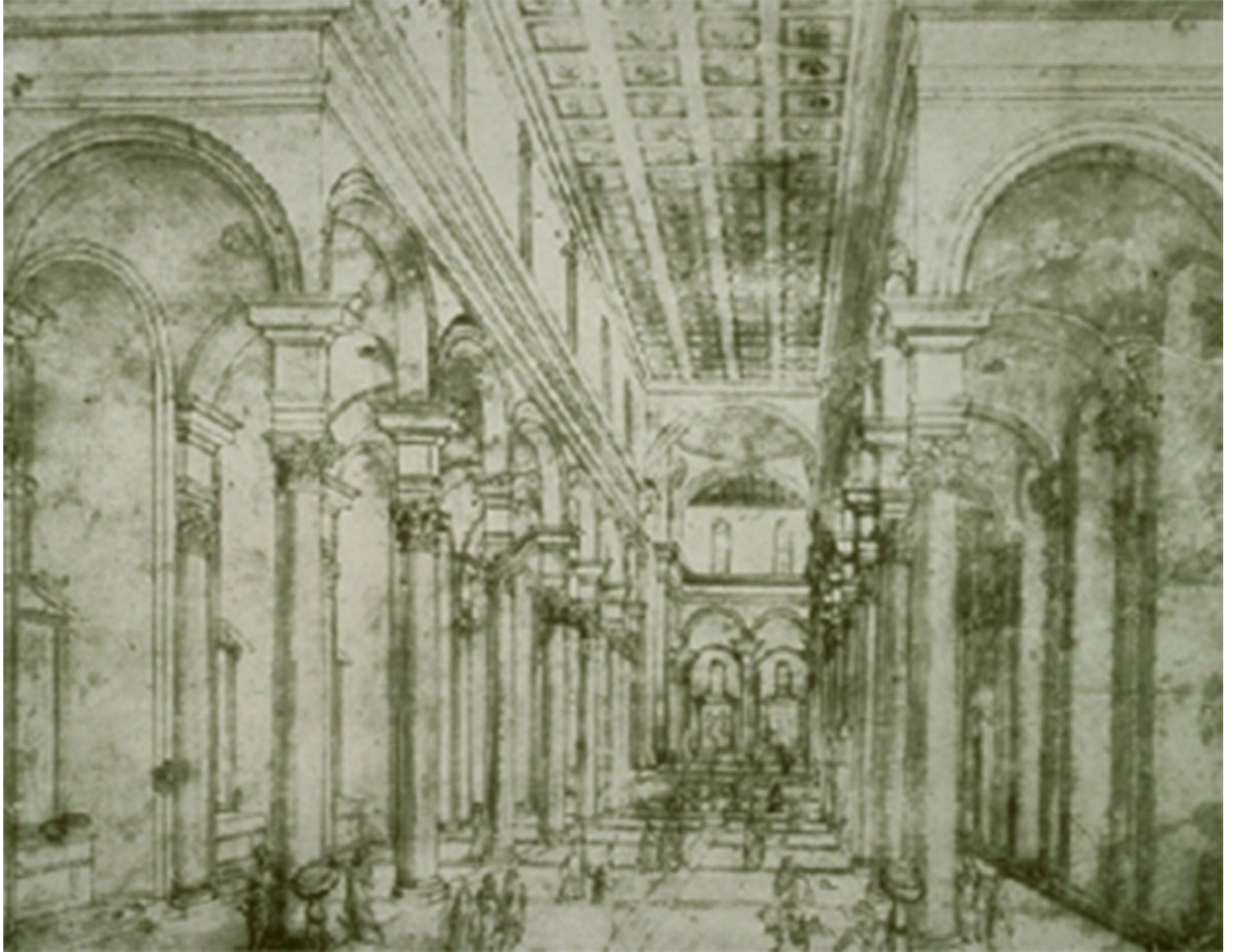
Εικόνα 1. Filippo Brunelleschi, προοπτικό σχέδιο για την Εκκλησία του Santo Spirito στη Φλωρεντία, c.1428

χρονικά σε διαφορετικές πόλεις και εποχές και αναδεικνύοντας τις κοινωνικές, πολιτισμικές και ιδεολογικές διαστάσεις της αρχιτεκτονικής.