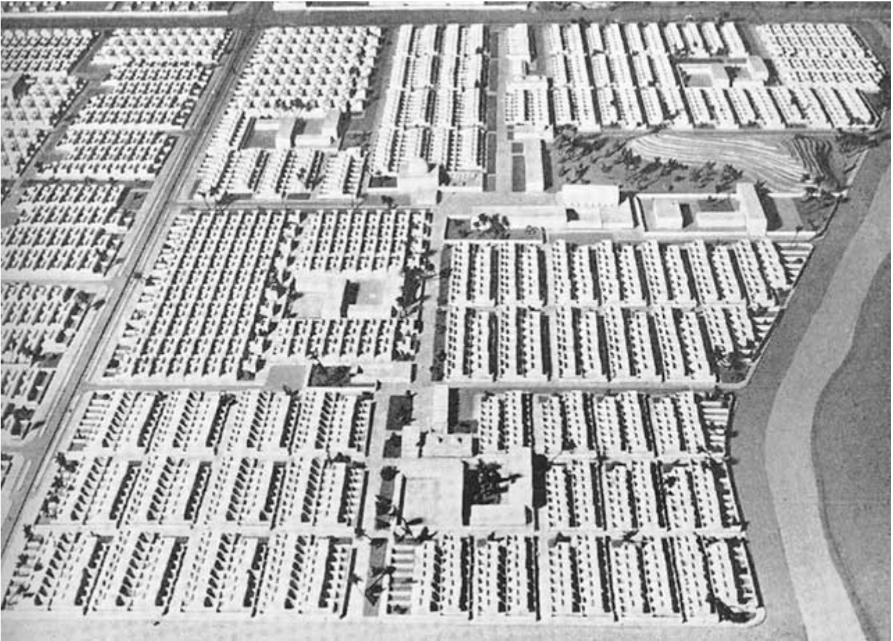
(Εικ.2) Σχέδιο κοινοτικού τομέα στη δυτική Βαγδάτη. Slides 9332

Μοιάζει όμως, παρόλα αυτά ότι σε αντίθεση με τους φαρδείς δρόμους και τα διοικητικά και εμπορικά κέντρα των οικιστικών τομέων, ή τις εκτάσεις πρασίνου που διαχώριζαν τις λειτουργικές ζώνες της πόλης, οι πλατείες κουτσομπολιού δεν αποσκοπούσαν απλώς στην βελτιστοποίηση της αποδοτικότητας της νέας πόλης, (Εικ. 2) αλλά αντίθετα, είχαν σκοπό να ανταποκριθούν στα τοπικά πολιτισμικά μοτίβα των Ιρακινών χωριών και να αποδείξουν ότι το γραφείο Δοξιάδη επεδίωκε την ενσωμάτωση του τοπικού χαρακτήρα στην εξορθολογισμένη μεθοδολογία του οικιστικού σχεδιασμού.