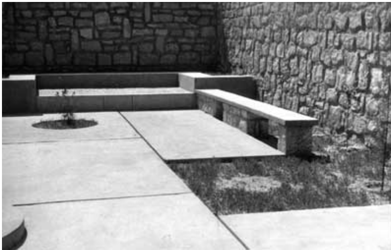
(Εικ.4) Πλατεία κουτσομπολιού στη Μοσούλη. Archive Files 23970

Σε συμφωνία με τις πολιτικές του Ιρακινού καθεστώτος για την εξάλειψη θρησκευτικών και φυλετικών διακρίσεων και την διαμόρφωση μιας κοινής εθνικής ταυτότητας και υπερηφάνειας, το γραφείο Δοξιάδη επιχείρησε να προωθήσει μια σταδιακή και ελεγχόμενη ανάμειξη των κοινωνικών τάξεων και να επικουρήσει τη «σταδιακή μετάβαση» του λαού από την οικογενειακή ζωή στην «εθνική ζωή ενός ολόκληρου έθνους». Αυτή η απόπειρα κοινωνικής μηχανικής που συχνά περιγράφηκε από τον ίδιο τον Δοξιάδη -τόσο στην εισήγηση του προς το Διοικητικό Συμβούλιο Ανάπτυξης του Ιράκ όσο και στις οδηγίες που παρείχε στους πολυάριθμους σχεδιαστές που δούλευαν για αυτόν σε Βαγδάτη και Αθήνα- αναμένονταν να ξεκινήσει ακριβώς μέσα από τις μικρές πλατείες γειτονιάς και κουτσομπολιού, οι οποίες θα ευνοούσαν «τη συγκρότηση κοινότητας». 9 Ο απώτερος στόχος ήταν η δημιουργία ενός «ευτυχημένου και ασφαλούς περιβάλλοντος για να μένουν οι άνθρωποι». 10 (Εικ.4) Έτσι, το μοντερνιστικό όνειρο για παροχή μιας καλύτερης ζωής θα εκπληρώνονταν. Στο πλαίσιο του πολιτικού γίνεσθαι στη Μέση Ανατολή και της διαπλεκόμενης γεωπολιτικής των μέσων του 20ου αιώνα, οι ευτυχημένοι και ασφαλείς πολίτες αποτελούσε μια υπόσχεση τόσο στην φίλο-δυτική μοναρχία όσο και στους ξένους υποστηρικτές της, ότι το Ιράκ μπορούσε να αποφύγει τις κοινωνικές επαναστάσεις.