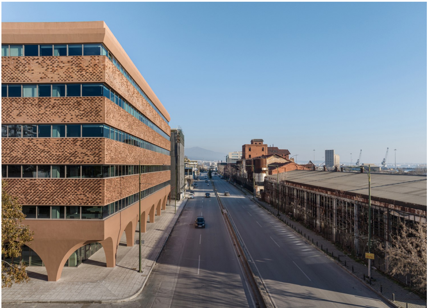
Εικόνα 13: Το νέο συγκρότημα HUB 26 των Divercity Architects απέναντι από το πρώην εργοστάσιο Χυμοφιξ του Ζενέτου