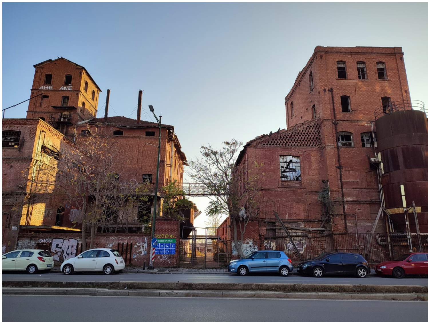
ΕΙΚΟΝΕΣ 2,3: Απόψεις της πρώην ζυθοποιίας Φιξ

Το μεγαλύτερο αρχιτεκτονικό ενδιαφέρον της περιοχής βρίσκεται ωστόσο μετά το εμπορικό κέντρο «Λιμάνι», με επίκεντρο το παλιό εργοστάσιο ζυθοποιίας «ΦΙΞ». Το βιομηχανικό συγκρότημα ζυθοποιίας, όπως σώζεται σήμερα, κατασκευάστηκε σε διάφορες φάσεις κυρίως από το 1882 ως το 1926 (Δούση κ.ά, 2004), την εποχή της Οθωμανικής αυτοκρατορίας, μέχρι τη δεκαετία του 1960. Περιήλθε στην ιδιοκτησία της εταιρείας Φιξ το 1926 και λειτούργησε μέχρι το 1983. Η πρώτη φάση του εργοστασίου είναι κατασκευασμένη από φέρουσα τοιχοποιία και οι όψεις είναι από εμφανείς οπτόπλινθους και ιδιαίτερο «δομικό» διάκοσμο που δημιουργεί ένα ιδιαίτερα εκφραστικό αποτέλεσμα. Το συγκρότημα χαρακτηρίστηκε διατηρητέο μνημείο το 1994. Μια σειρά από κτίρια των τελευταίων δεκαετιών που βρίσκονται στην 26ης Οκτωβρίου, απέναντι από το εργοστάσιο, εμπνέονται από την αρχιτεκτονική του Φιξ και χρησιμοποιούν το σύγχρονο αρχιτεκτονικό λεξιλόγιο στην υπηρεσία της διατήρησης και ταυτόχρονης αναβάθμισης του ιδιαίτερου χαρακτήρα της περιοχής.