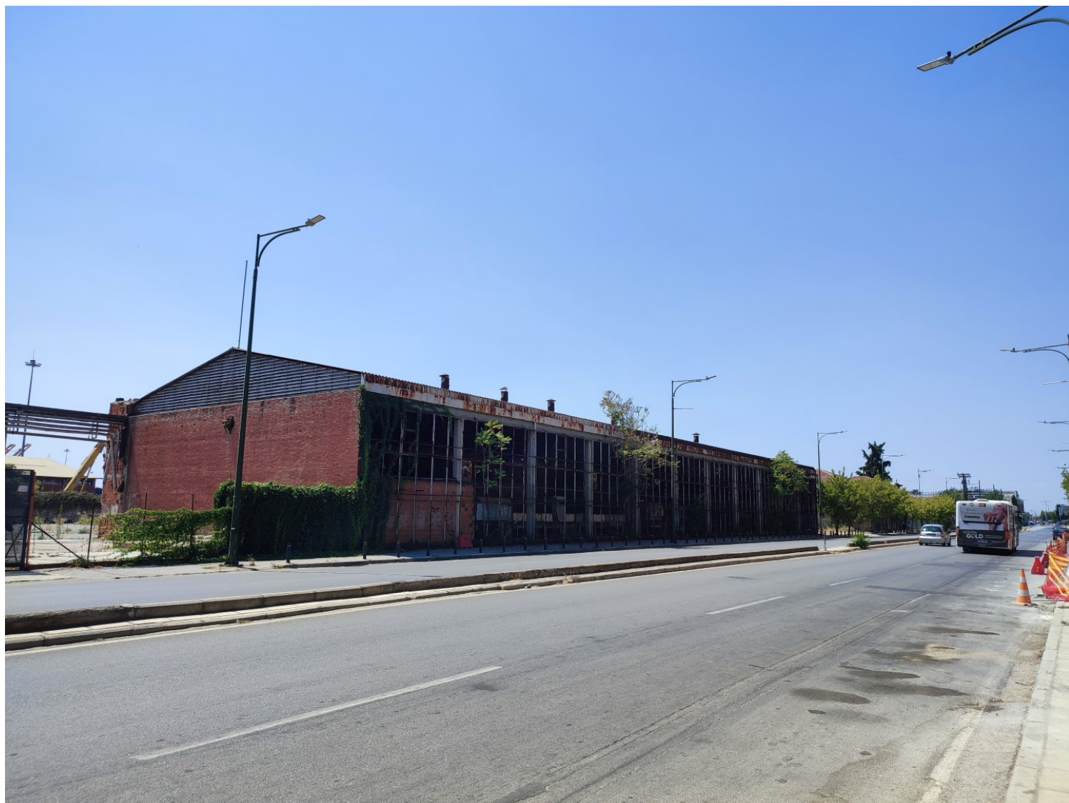
Εικόνα 12: Το νεότερο εμφιαλωτήριο (Εργοστάσιο Χυμοφιξ) σήμερα