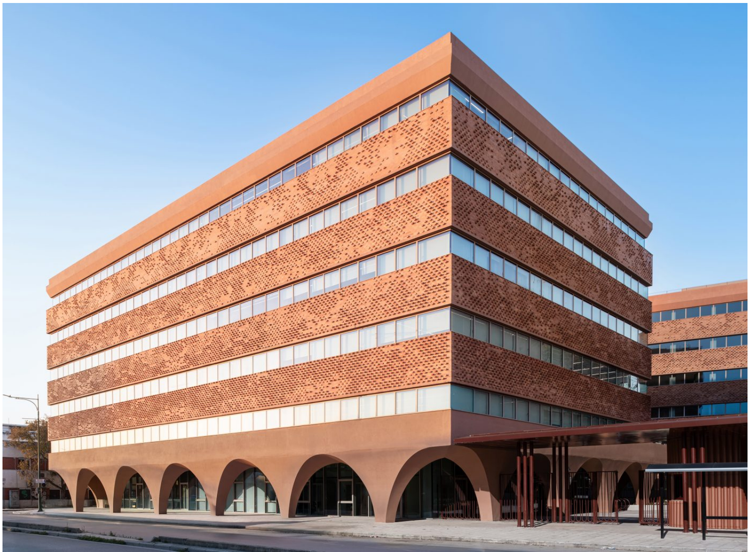
Εικόνα 15: Αποψη του νέου συγκροτήματος HUB 26 των Divercity Architects από την Οδό 26ης Οκτωβρίου