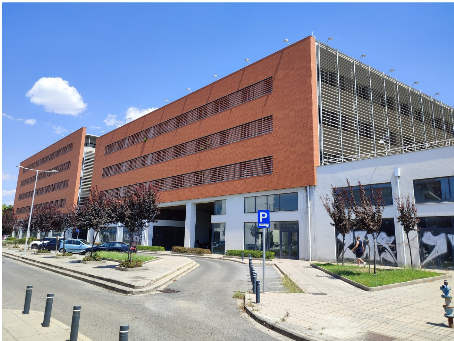
ΕΙΚΟΝΕΣ 8, 9: Απόψεις των νέων εγκαταστάσεων της ΠΚΜ σχεδιασμένων από τη μελετητική εταιρία ΜΕΤΕ ΣΥΣΜ (2007-2016)