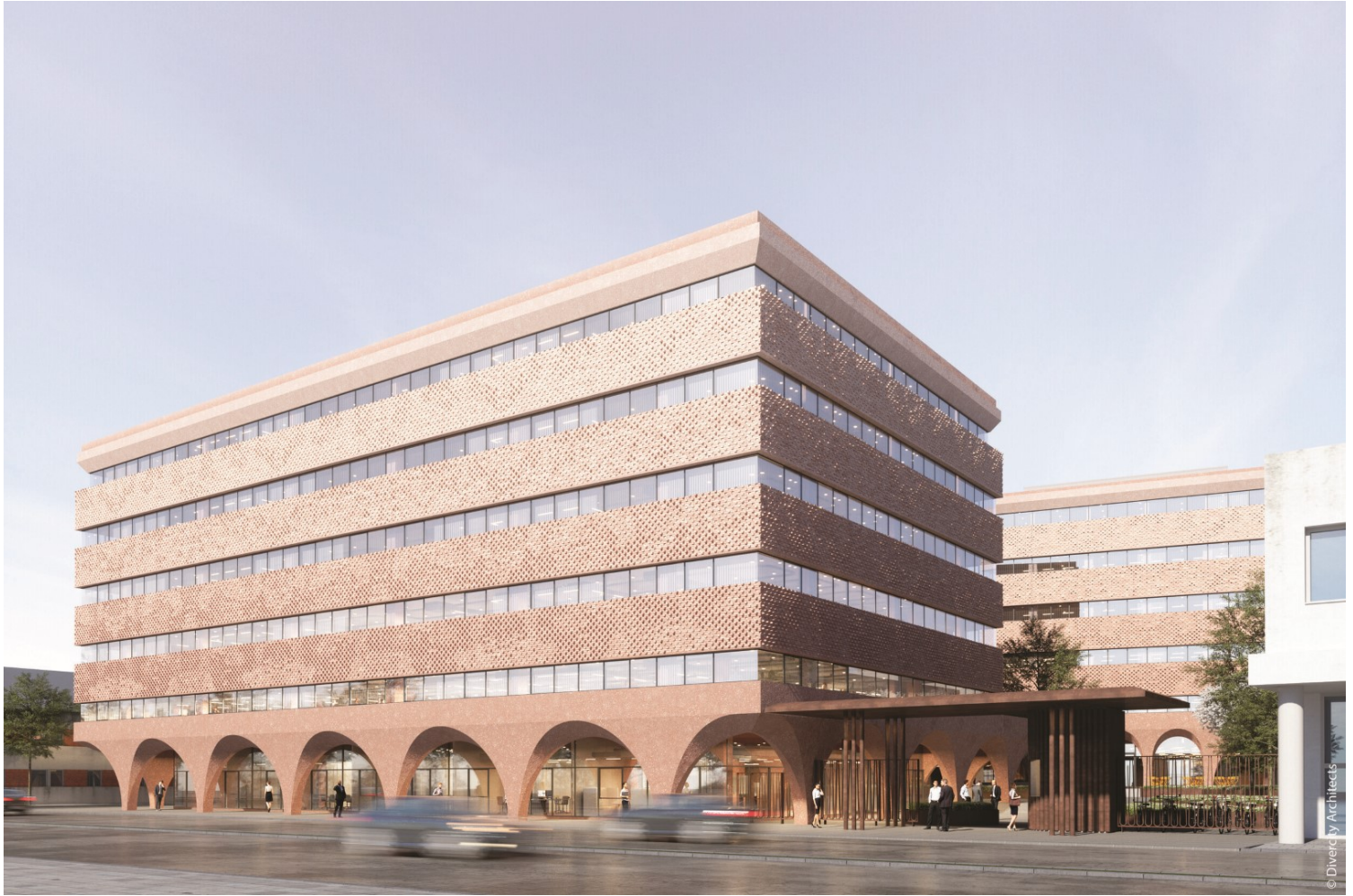
Εικόνα 14: Το νέο συγκρότημα HUB 26 των Divercity Architects. Απεικόνιση που δείχνει την πρόθεση να «χάνεται» στην ομίχλη

ομίχλη της πόλης. Οι αρχιτέκτονες σημειώνουν χαρακτηριστικά ότι «ο αποχρωματισμός του κτιρίου προς τη στέψη μαζί με το ανάγλυφο, το οποίο μειώνεται προς τα επάνω, δημιουργούν την εντύπωση ότι το κτίριο αποσυντίθεται, όπως το περίγραμμα της πόλης μέσα στην ομίχλη» (ΚΤΙΡΙΟ, 4/2025, σ.44) (εικ.14).