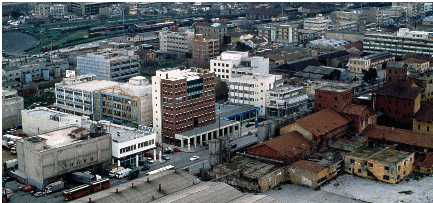
ΕΙΚΟΝΑ 4: Δ. Φατούρος, Γ. Τριανταφυλλίδης, Κτίριο Γραφείων στη Δυτική Είσοδο της Θεσσαλονίκης, 1990