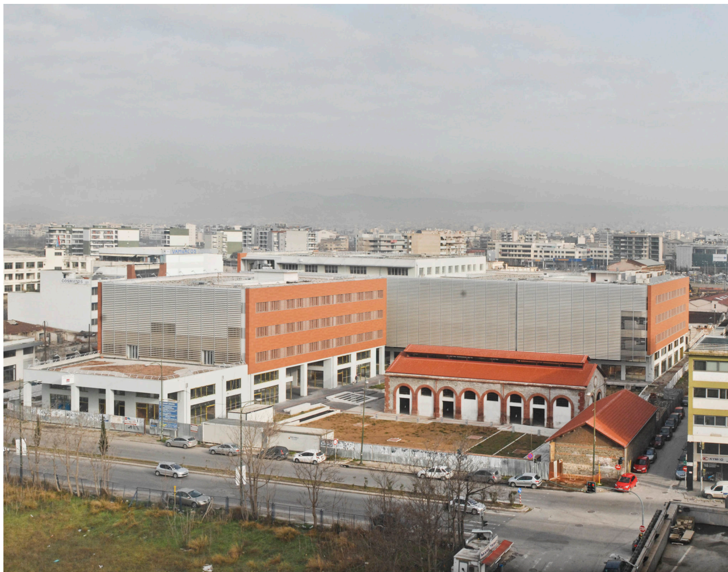
ΕΙΚΟΝΑ 7: Απόψεις των νέων εγκαταστάσεων της ΠΚΜ σχεδιασμένων από τη μελετητική εταιρία ΜΕΤΕ ΣΥΣΜ (2007-2016)