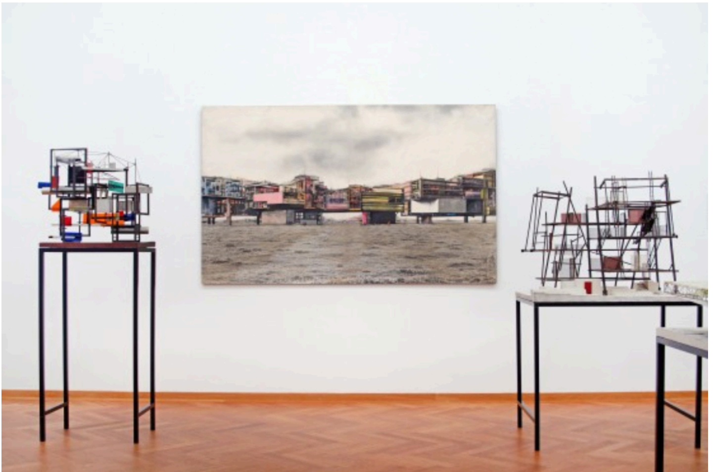
Kunstmuseum, New Babylon, Situationist International | 19 αρχιτεκτονικά μοντέλα, 72 σκίτσα, 48 τυπώματα/μεταξοτυπίες, 4 ζωγραφικοί πίνακες

Οι αντιδράσεις μεταφέρθηκαν και στην ευρύτερη εικαστική σκηνή. Η εννοιολογική τέχνη (conceptual art), η arte povera , η στροφή προς την αρχαιολογία και τη λαογραφία και η αναζήτηση με κατεύθυνση το περιβαλλοντολογικό αποτύπωμα ήταν βασικοί εικαστικοί άξονες που καθόρισαν τη δεκαετία του 1960. Την ίδια περίοδο, ανεξάρτητες ομάδες όπως αυτές των Archigram , Situationist International (Καταστασιακοί Διεθνούς), Archizoom κ.α., σαφώς επηρεασμένοι από την πολιτική θέση της εικαστικής σκηνής, ανοίγουν διάλογο γύρω από τον σχεδιασμό και τον χώρο. Οι νέες τοποθετήσεις σχολιάζουν σε θεωρητικό και χωρικό επίπεδο την ιδεολογία του μοντέρνου κινήματος, προτείνοντας μια “anti-design” μεθοδολογία στη μέχρι τότε σχεδιαστική πραγματικότητα (Brayer, 1960, σελ. 361), και έτσι σηματοδοτούν οριστικά την πρώιμη Πειραματική Αρχιτεκτονική.