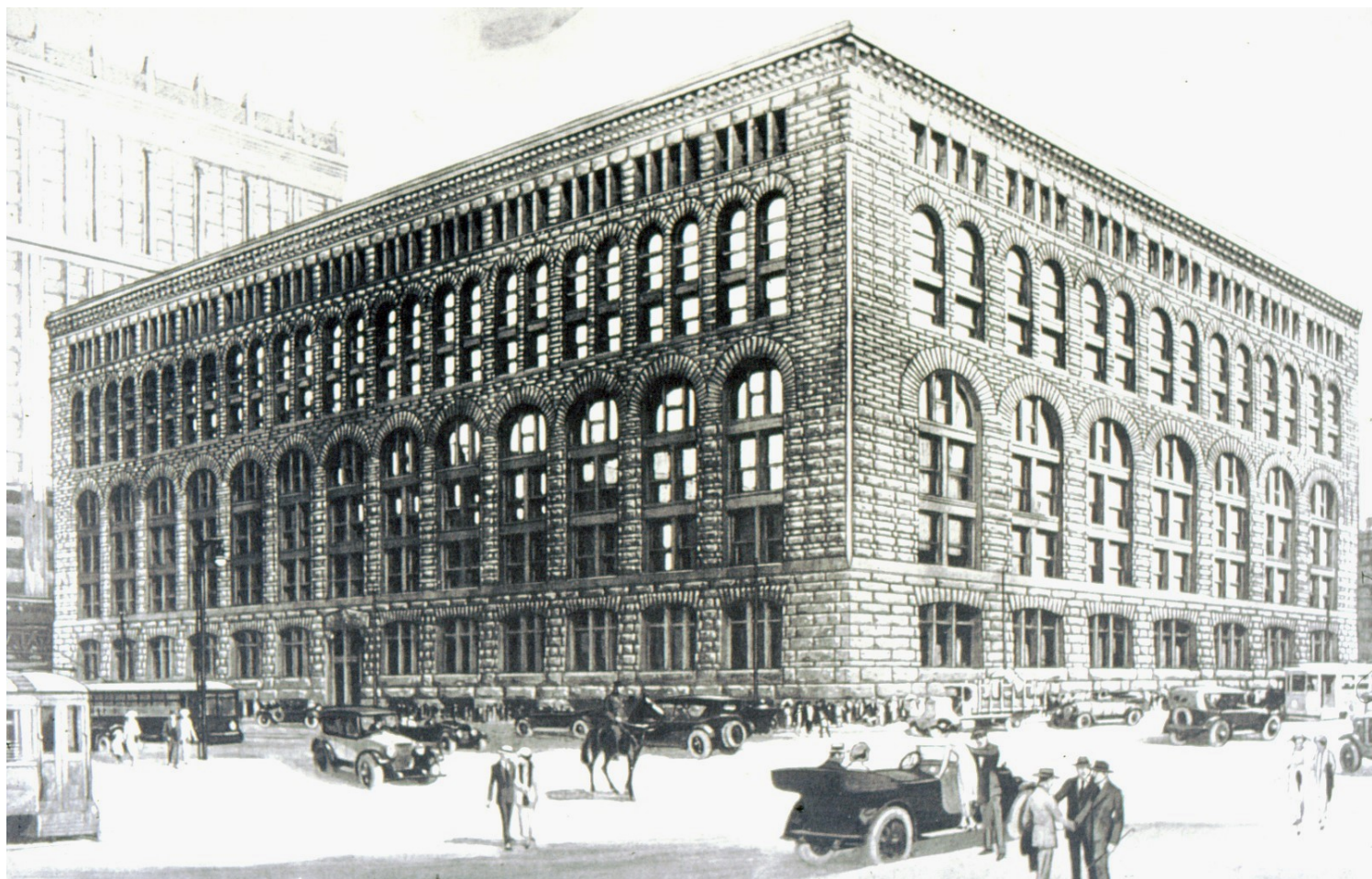
Henry Hobson Richardson, Marshall Field Store, Σικάγο, 1885-87 (κατεδ. 1930).

Η εποχή άλλωστε είναι ευνοϊκή: ο μεταμοντερνισμός κυριαρχεί στην εποχή του σχεδιασμού της Τράπεζας και ο Βαλσαμάκης τολμά τη διατύπωση μιας πρότασης, κάτω από τον Παρθενώνα, που να συνδιαλέγεται με την ιστορία της πόλης και τα πολιτισμικά συμφραζόμενα με τρόπο όμως λιτό, θα λέγαμε αθηναϊκό, χωρίς τις ακρότητες της μεταμοντέρνας κουλτούρας της εποχής. Άλλωστε η νομιμοποίηση της μνημειακότητας και της συμμετρίας στην αρχιτεκτονική είχε ήδη επιχειρηθεί με επιτυχία: το 1980 εγκαινιάζοταν στο παρισινό Μπομπύρ η περίφημη έκθεση «Les Realismes 1919-1939» που απενοχοποιούσε μέρος της αρχιτεκτονικής του ολοκληρωτισμού, με την ανάδειξη έργων όπως το εμβληματικό Μέγαρο του Ιταλικού Πολιτισμού στο σημερινό EUR της Ρώμης, μια αρχιτεκτονική «μεταφυσική» α λα Ντε Κίρικο.