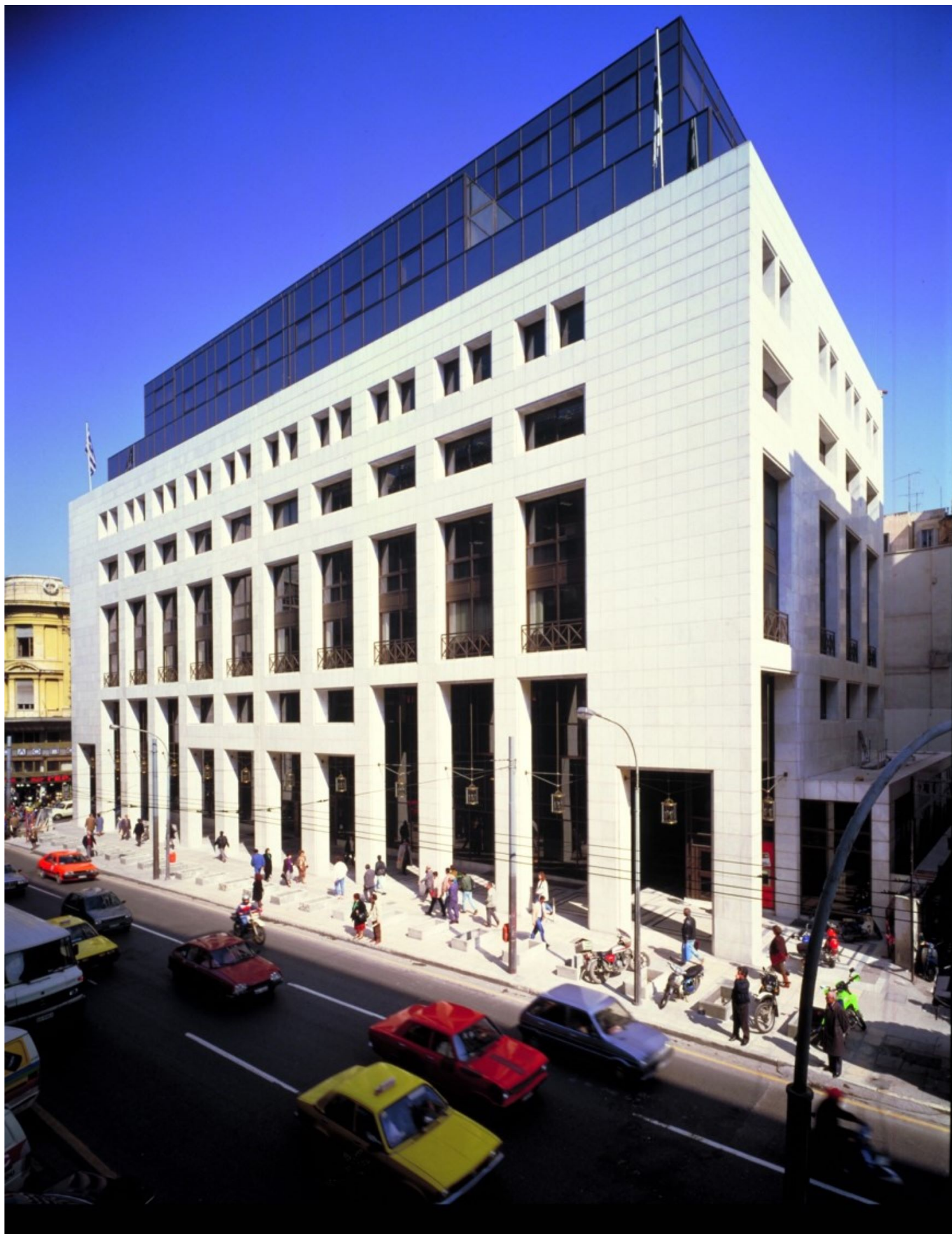
Νίκος Βαλσαμάκης-Κώστας Μανουηλίδης, Τράπεζα Πίστωσης, 1981-86. Το άλμα από την προηγούμενη μελέτη είναι εντυπωσιακό.