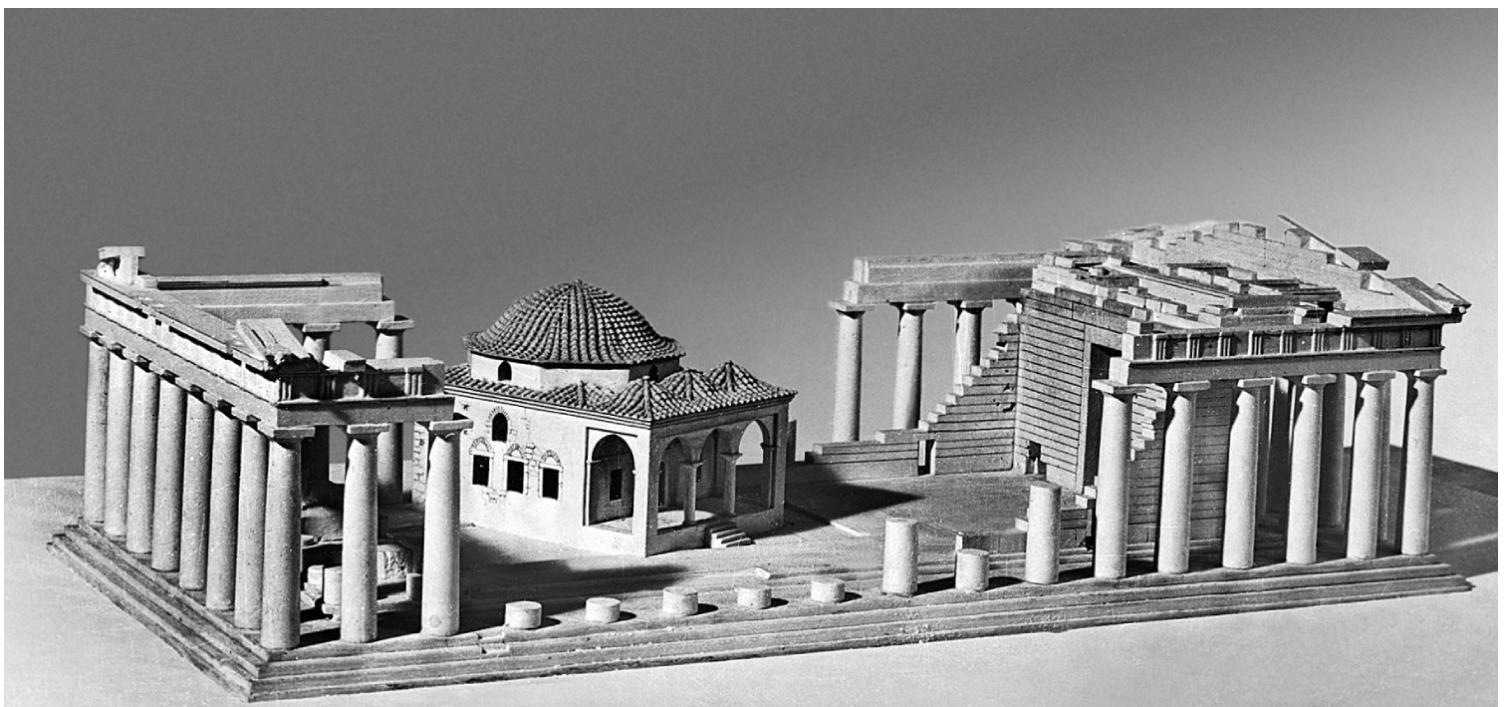
Πρόπλασμα του Παρθενώνα με το τζαμί στο εσωτερικό του που κατεδαφίστηκε το 1842. Αναπαράσταση Ι. Τραυλού, 1945.

Από τα τέλη της δεκαετίας του 1930, ο Τραυλός ξεκινά τη συστηματική του ενασχόληση με την Αθήνα.