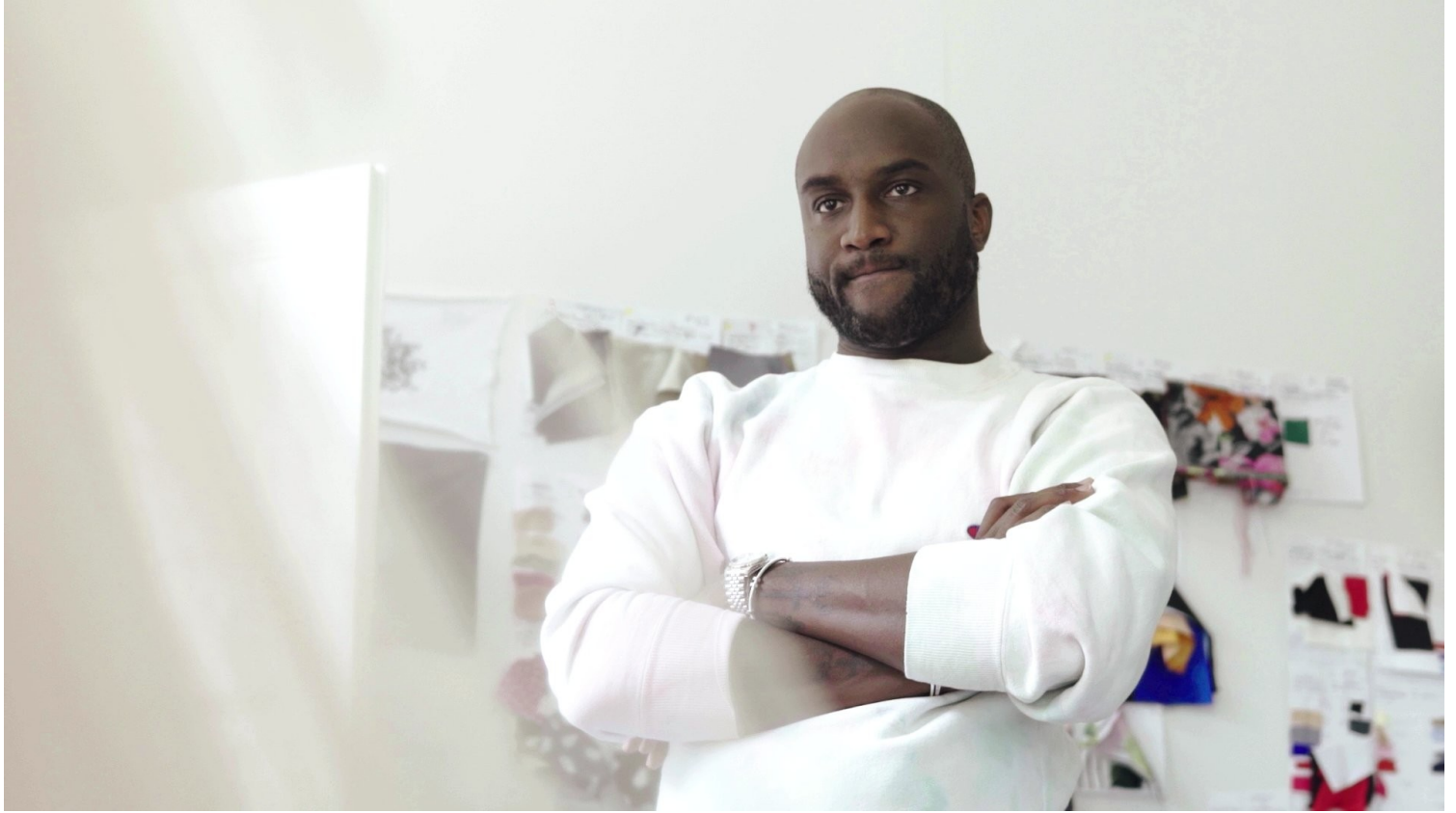
Virgil Abloh | The New York Times