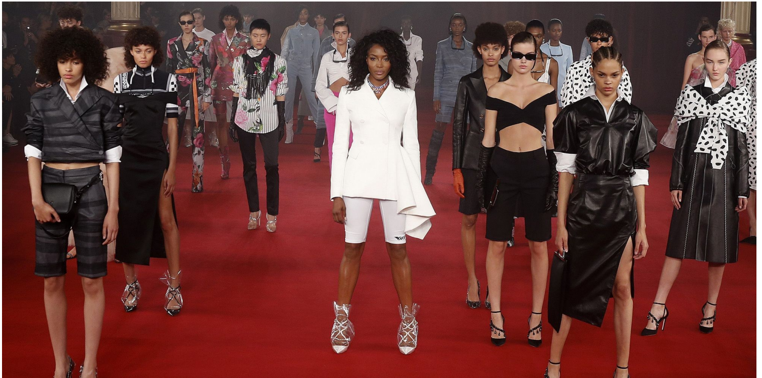
Naomi Campbell Closed The Off-White Show in A Princess Diana-Inspired Look | elle.com

Γεννημένος το 1980 στο Rockford του Ιλλινόις, σπούδασε πρώτα ως πολιτικός μηχανικός στο Πανεπιστήμιο Madison του Wisconsin και, έπειτα, ολοκλήρωσε τις μεταπτυχιακές του σπουδές ως αρχιτέκτονας στο Illinois Institute of Technology. Κατόπιν, υπήρξε καλλιτεχνικός διευθυντής για τον Kanye West και στη συνέχεια ανέλαβε το ίδιο πόστο για την ανδρική συλλογή της Louis Vuitton. Ο Virgil ξεπερνούσε τα επαγγελματικά στεγανά και προσέφερε τη δημιουργικότητά του ως dj, σχεδιάζοντας ρούχα, αλλά και ρολόγια, χαλάκια, κεραμικά τούβλα, λάμπες, καρέκλες και οτιδήποτε άλλο του τραβούσε το ενδιαφέρον. “Δεν πιστεύω σε επαγγέλματα ( disciplines )”, λέει το 2020. “Μπορούμε να χρησιμοποιήσουμε το αρχιτεκτονικό μας μυαλό για να κάνουμε πολλά πράγματα και όχι μόνο για να κάνουμε ό,τι υποτίθεται πως πρέπει να κάνουμε”.