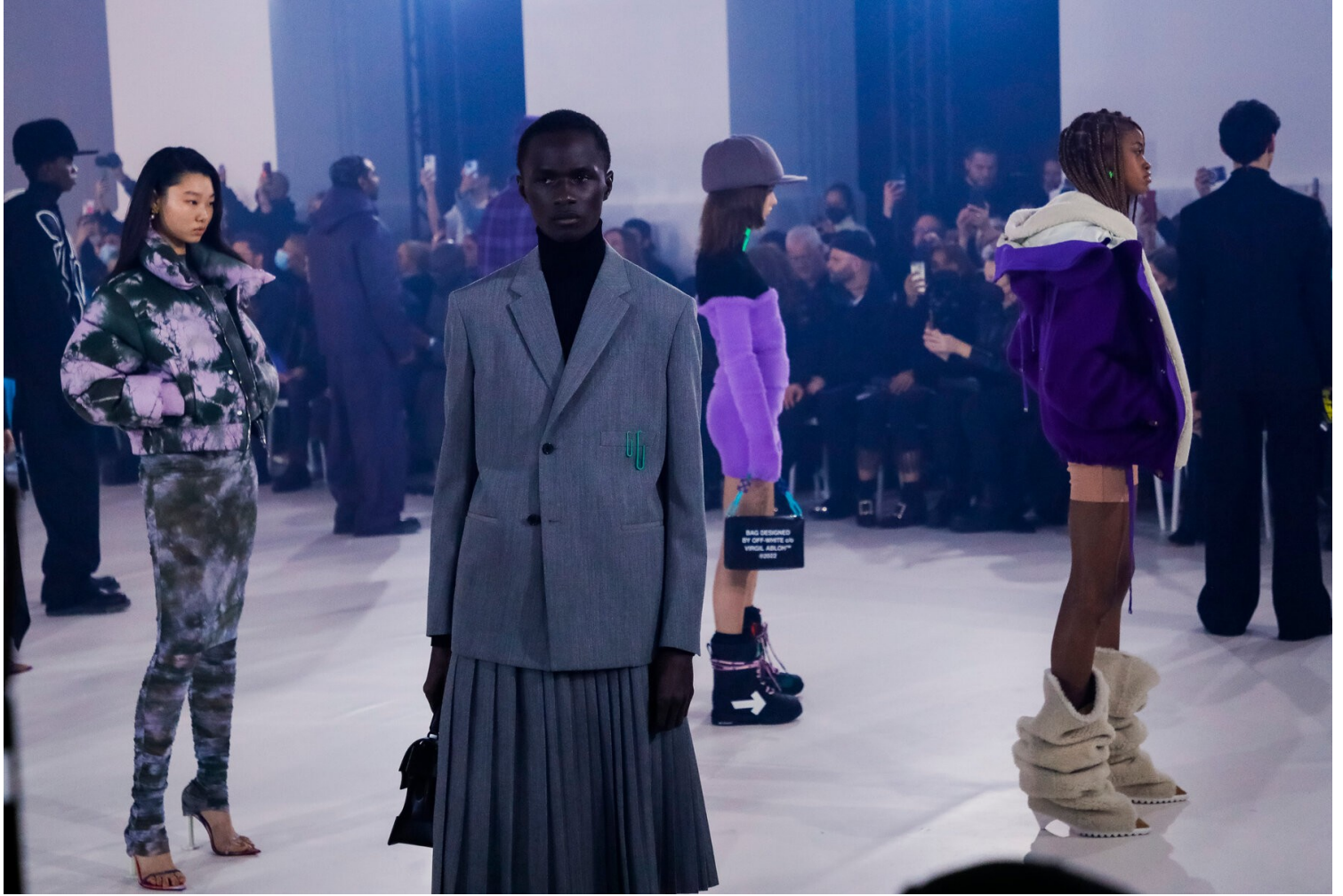
OFF WHITE Runway | The New York Times