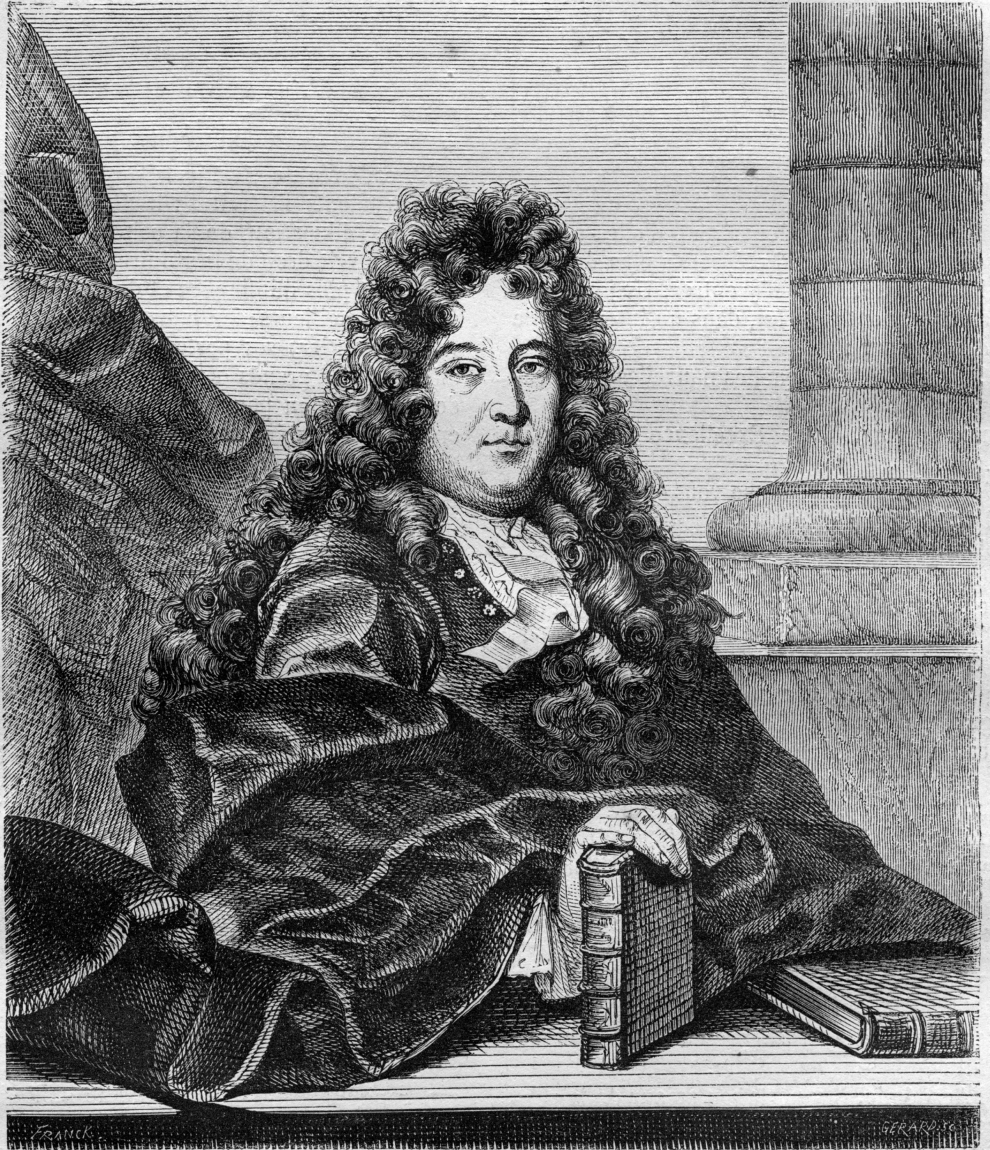
Charles Perrault. Dessin de Franck.