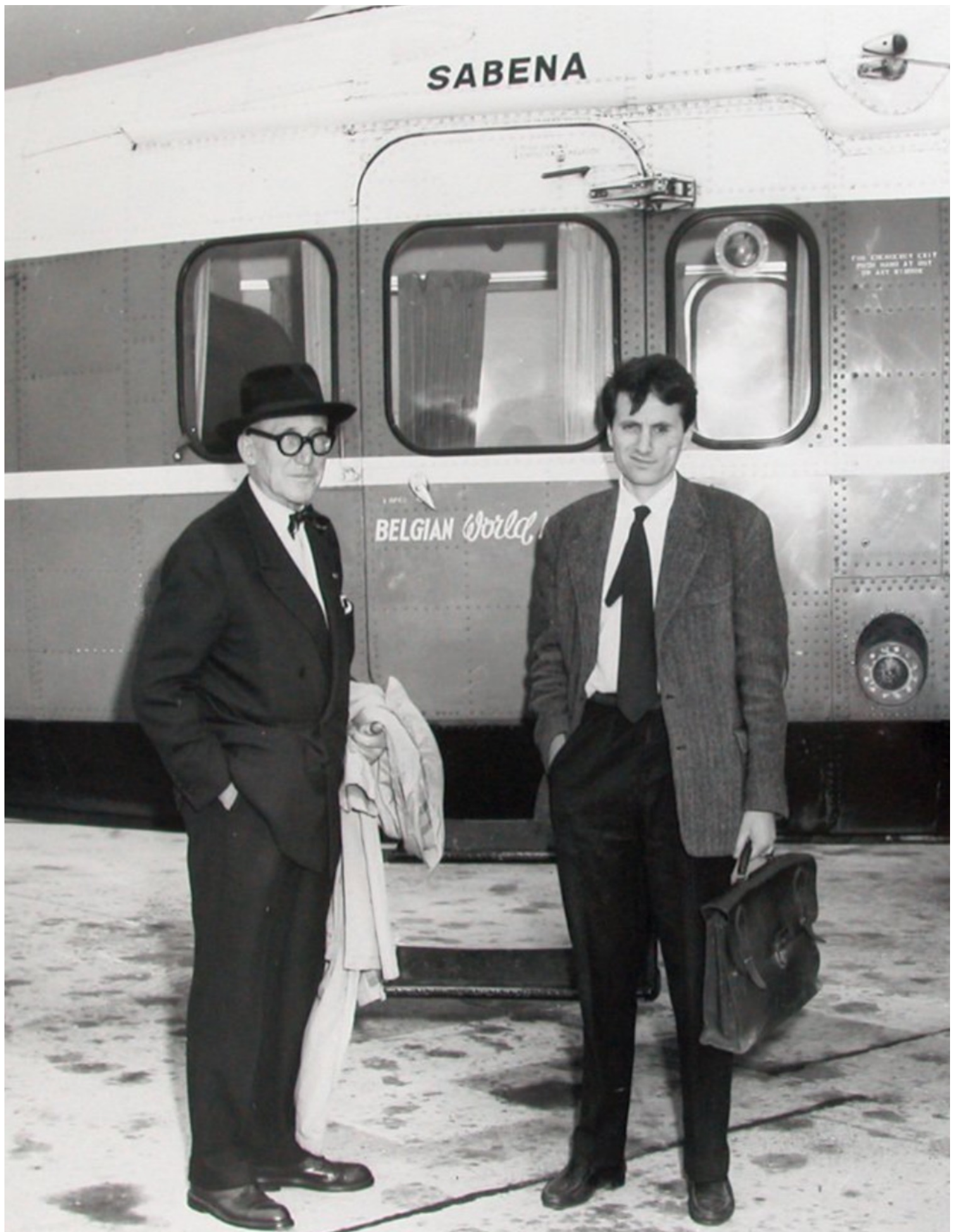
Ο Corbusier με τον Ιάννη Ξενάκη στις Βρυξέλλες, μπροστά σε λεωφορείο της βελγικής αεροπορικής Εταιρείας Sabena (1955;)

Δέκα περίπου χρόνια μετά από το προαναφερθέν επεισόδιο, το 1955 (ή 1956;), ήρθε η παραγγελία του Περιπτέρου της Philips, του οποίου τη μελέτη ο Corbusier εμπιστεύθηκε και ανέθεσε στον Ξενάκη. Εδώ, τα μαθηματικά, οι εκ περιστροφής επιφάνειες και τα εξ αυτών παραγόμενα στερεά, καθώς είναι και τα