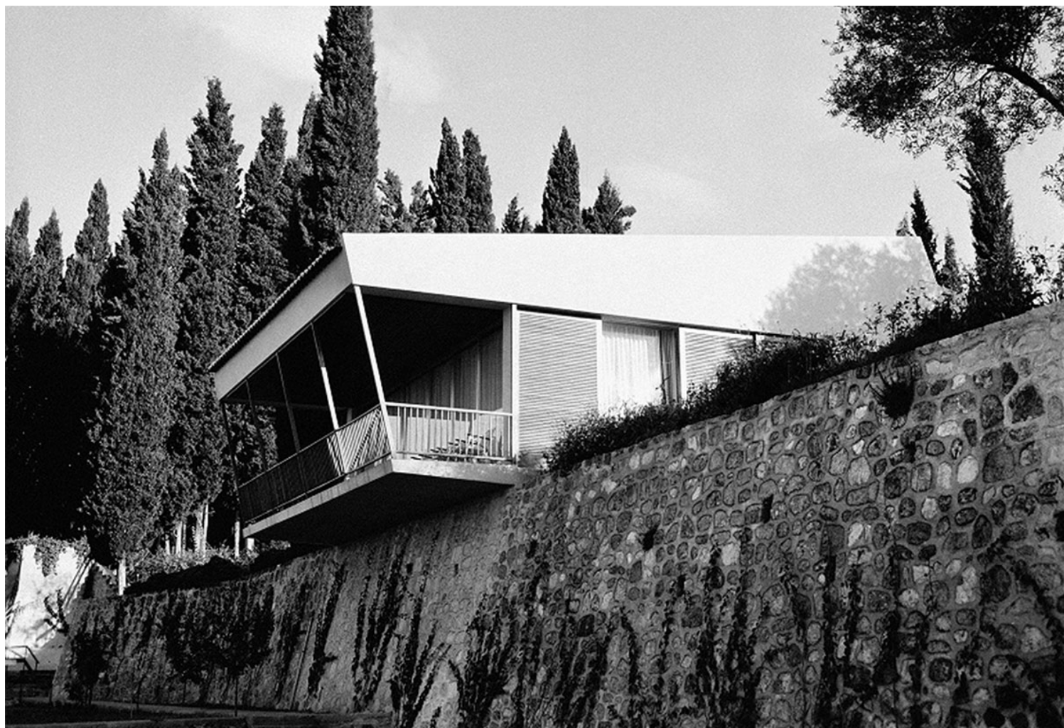
Β. Μπογάκος, Περίπτερο κατοικίας Βεργωτή στην Κεφαλονιά, 1971.