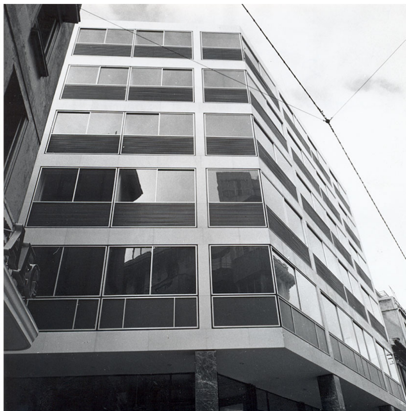
P. Belluschi, Equitable Building, Πόρτλαντ, 1944-48 / Β.Μπογάκος, Κτίριο γραφείων, Πραξιτέλους και Χαβρίου, Αθήνα, 1966.

Ο «ελληνικός εκσυγχρονισμός» της γενιάς του Μπογάκου δεν είναι μόνο μορφοπλαστικός αλλά και τεχνολογικός. Η πραγμάτωση του τεχνολογικού οράματος συνιστά πιστοποιητικό νεωτερικότητας -το γνωρίζουμε και από τον Βαλσαμάκη- και τεκμήριο μιας αρχιτεκτονικής που επιδιώκει να ανταποκριθεί με απαιτήσεις στα πρότυπα. Γιατί δεν υπάρχει αμφιβολία ότι η δημιουργικότητα των καθ' ημάς αρχιτεκτόνων ενεργοποιείται από συγκεκριμένα πρότυπα διεθνή: τον Mies, τον Breuer, τον Neutra, τον Schindler, που εκπροσωπούν μάλιστα στο σύνολό τους τη δυναμική και κραταιά Βόρεια Αμερική στο πεδίο της παγκόσμιας αρχιτεκτονικής της μεταπολεμικής περιόδου. Στην περίπτωση ωστόσο του Μπογάκου, όπως εύστοχα επισημαίνει ο συγγραφέας, είναι ισχυρή και η επιρροή του Paul Rudolph και κυρίως του Δανού Arne Jacobsen, στο πλαίσιο μάλιστα του ενδιαφέροντος του Έλληνα αρχιτέκτονα για την «παράμετρο του design», ένα πεδίο στο οποίο ως γνωστόν ο Βορειοευρωπαίος συνάδελφός του έχει εξόχως διακριθεί.