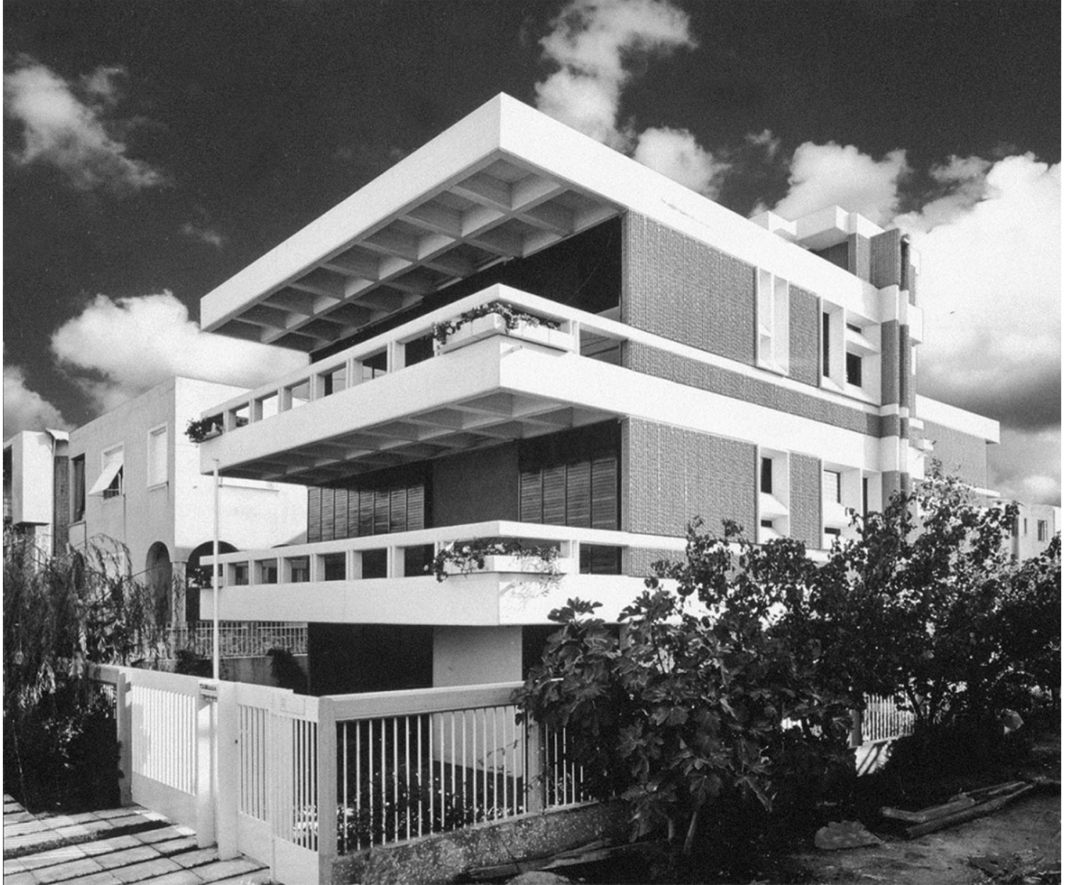
Β. Μπογάκος, Πολυκατοικία οδού Τζαβέλλα 4 στο Νέο Ψυχικό, 1968.

Μπογάκου. Το βιβλίο ολοκληρώνεται με μια σειρά ωραίων φωτογραφιών αρχείου των έργων και μια πλήρως τεκμηριωμένη εργογραφία του αρχιτέκτονα. Μια υποδειγματική δημοσίευση και από πλευράς μεθόδου και δομής, παράδειγμα και για άλλες που θα ήταν ευχής έργο να ακολουθήσουν.