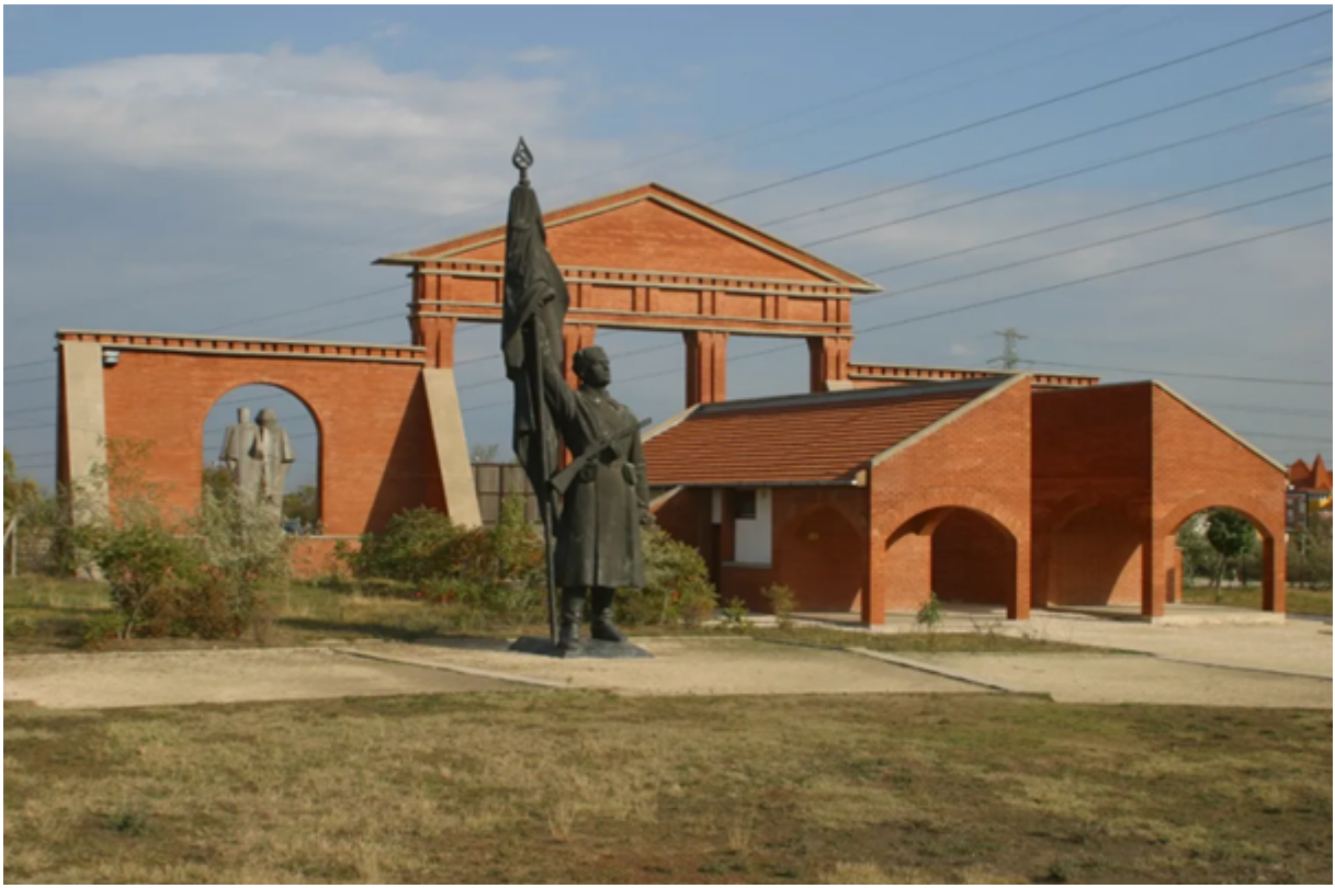
Πίσω από την είσοδο και πρόσοψη του πάρκου