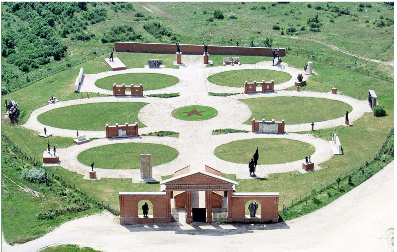
Γενική άποψη του Πάρκου των Αγαλμάτων

Σύμφωνα με την αρχιτεκτονική πρόταση, η οποία και υλοποιήθηκε κατά το μεγαλύτερο μέρος της, το πάρκο χωρίζεται σε δύο μέρη: