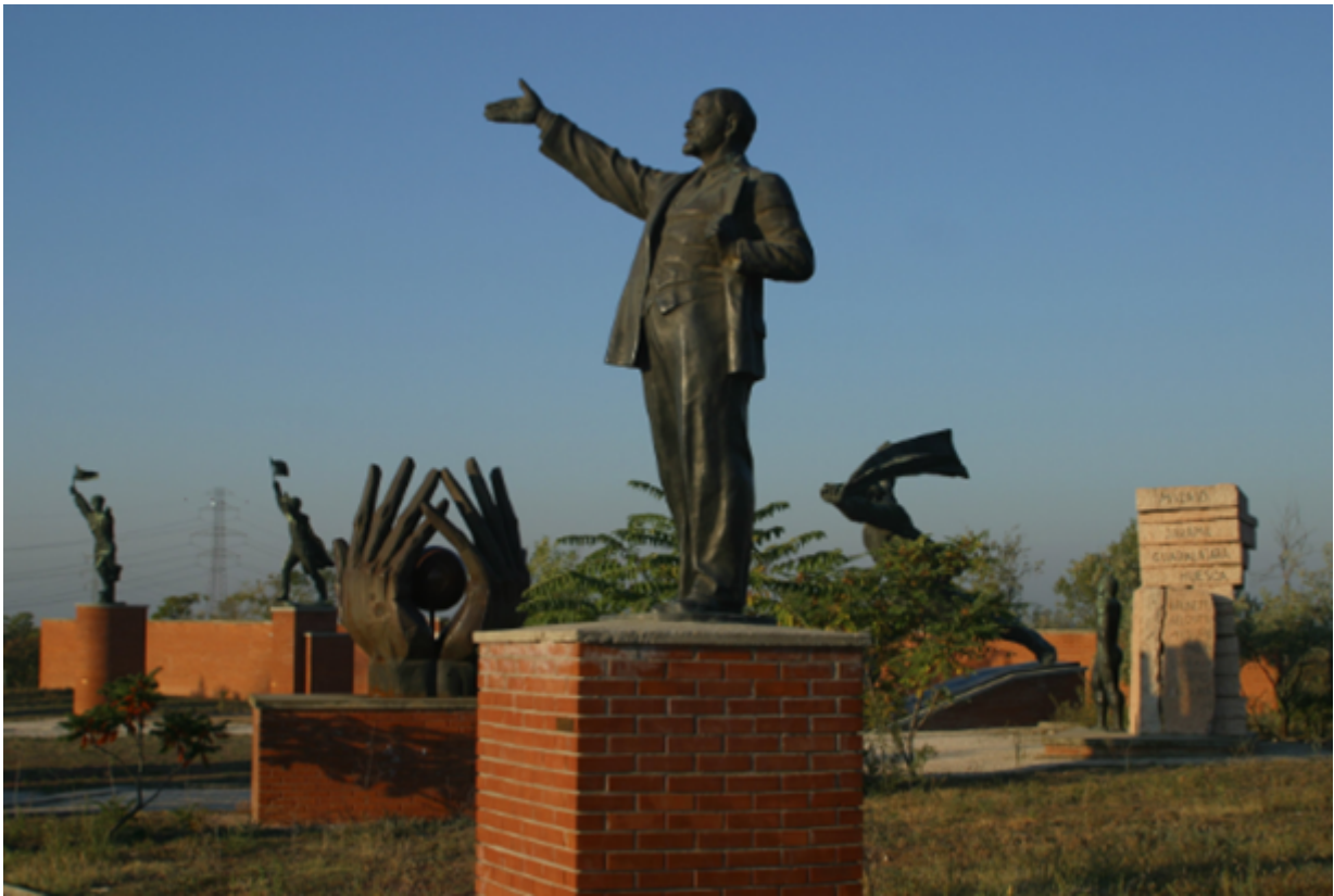
Αγάλματα στο εσωτερικό του πάρκου

Η νέα πολιτική τάξη που εγκαθιδρύεται το 1990 ωστόσο, παρά τον φιλελεύθερο χαρακτήρα της, έρχεται να περιγράψει τον εαυτό της ως “Δημοκρατία”, ανάγοντάς τον σ’ ένα αυταπόδεικτα ανώτερο ποιοτικά, ουδετεροποιημένο καθεστώς, το οποίο υπέρκειται των πολιτικών αντιπαραθέσεων στο όνομα μιας δίκαιης, συμπεριληπτικής και ελεύθερης κοινωνίας. Θέλοντας να σταθεί συνεπές σε μία τέτοια διακήρυξη, πριμοδοτεί μια δημόσια συζήτηση, με τις όποιες αντιπαραθέσεις της, σχετικά με τον δημόσιο χώρο και την τύχη των μνημείων του απερχόμενου καθεστώτος.