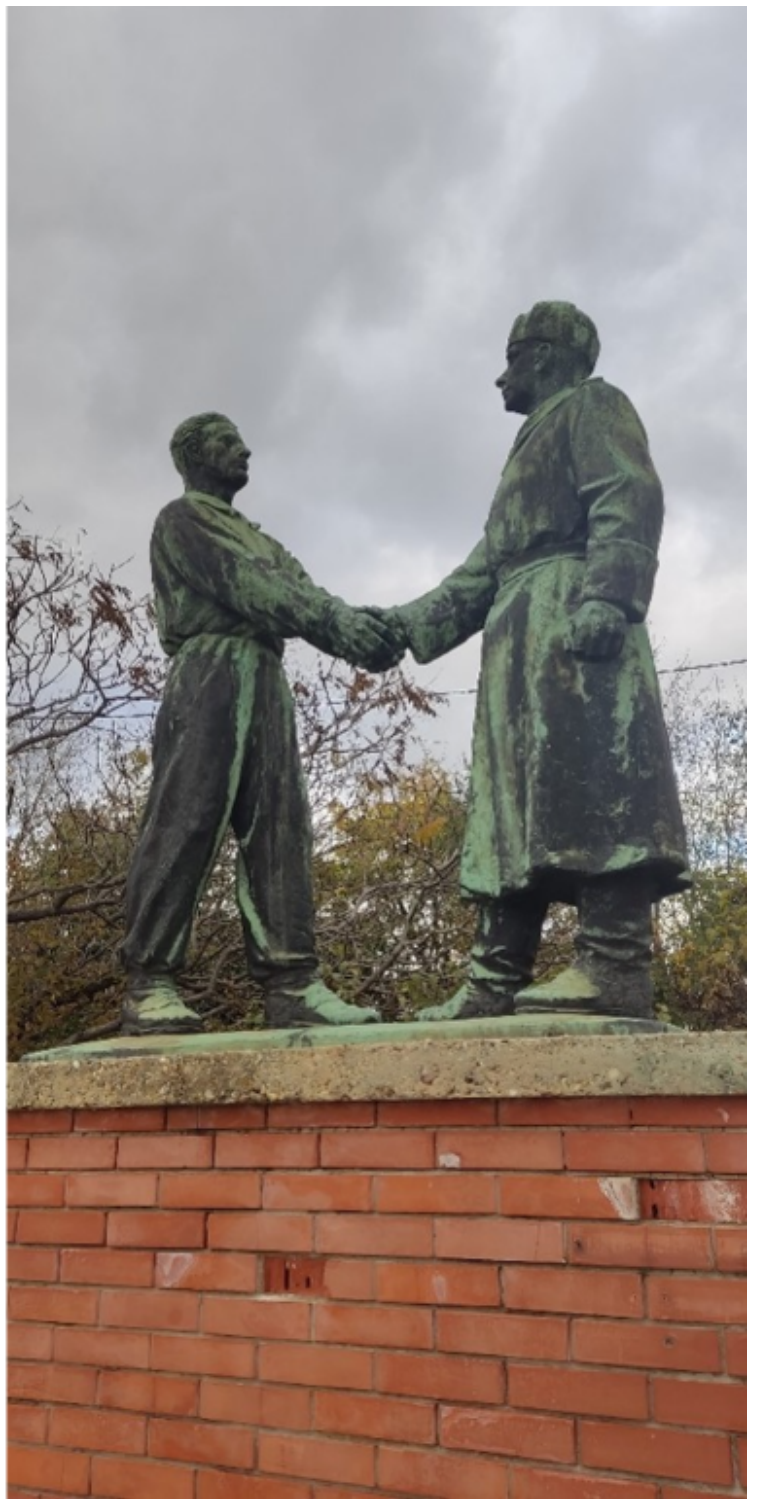
Πάνω: γλυπτό στο εσωτερικό του πάρκου | Κάτω: αριστερά ο Λένιν, δεξιά ο Ούγγρος υποδέχεται εγκάρδια τον στρατιώτη του Κόκκινου Στρατού