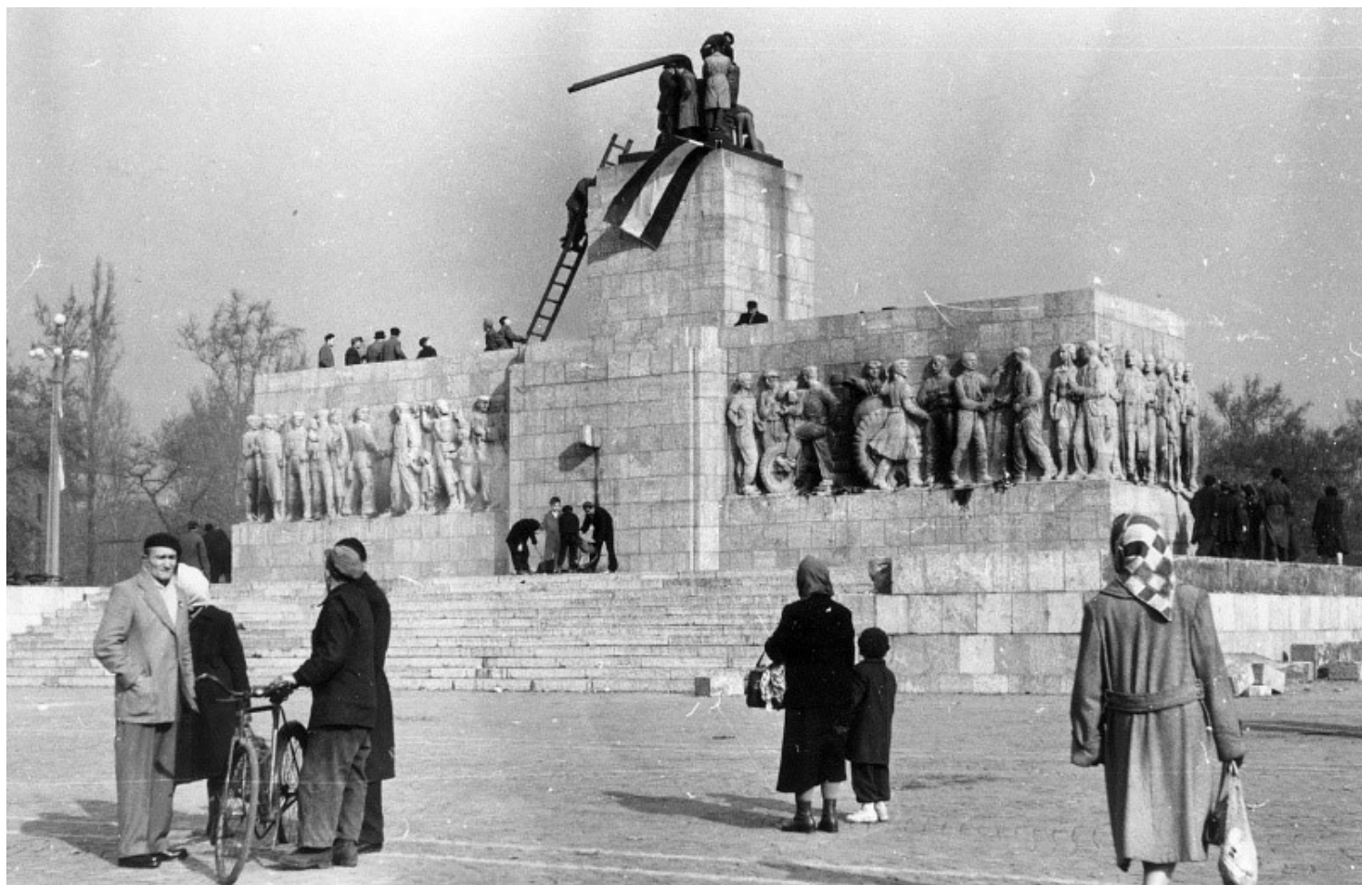
Πάνω: Το μνημείο του Στάλιν, Βουδαπέστη 1953 en.wikipedia.org | Κάτω: Οι μπότες του Στάλιν, 1956: ό,τι απέμεινε μετά την καταστροφή του, το 1956 en.wikipedia.org