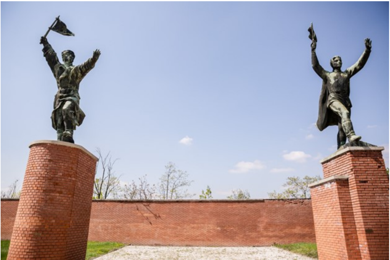
Στο βάθος, μεταξύ των αγαλμάτων, ο δρόμος οδηγεί στον τοίχο - αδιέξοδο.

Β. Πλατεία Μαρτύρων , μια τραπεζοειδούς σχήματος πλατεία, η οποία αποτελεί εννοιολογική συνέχεια του Πάρκου των Αγαλμάτων και χωροθετείται απέναντι από την είσοδό του.