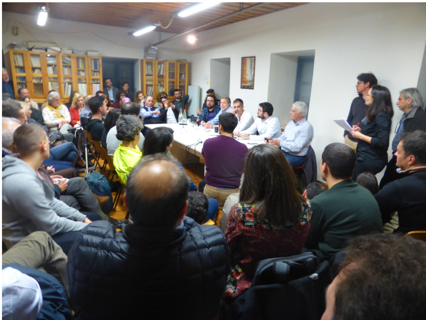
Εικόνα 5. Εκδήλωση «Αθήνα, ώρα για ποδήλατο», στον Σύλλογο Αρχιτεκτόνων, Μάρτιος 2019

Θα μπορούσαμε να επεκταθούμε και σε επιμέρους σχόλια για συγκεκριμένα σημεία του έργου αλλά ο χώρος δεν το επιτρέπει 13 . Το σημαντικό είναι να τονιστεί πως όλες οι παραπάνω επσημάνσεις αποτελούν σημαντικές προϋποθέσεις για την επιτυχία των σχεδιαζόμενων παρεμβάσεων. Πολλές από αυτές απαιτούν βούληση και συνεργασία σε κεντρικό επίπεδο. Οι επιμέρους φορείς και υπουργεία οφείλουν να συνεργαστούν.