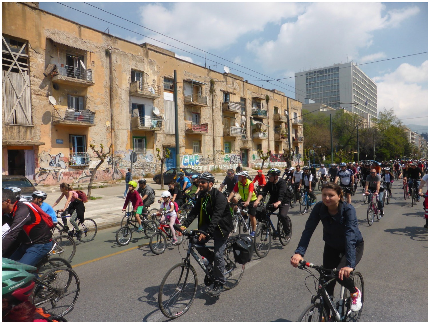
Εικόνα 6. Ποδηλατοπορεία, Απρίλιος 2019

Μέσα στον τελευταίο μήνα έχει συμβεί μια εμφανής και πρωτοφανής αλλαγή. Χιλιάδες οδηγοί αυτοκινήτων ξαφνικά βρέθηκαν στη θέση του πεζού και του ποδηλάτη καθώς βγήκαν να ποδηλατήσουν, να περπατήσουν ή να τρέξουν για «άσκηση» μέσα στην πόλη. Το γεγονός αυτό άλλαξε πολλές συνειδήσεις. Για πρώτη φορά οι οδηγοί κινούνταν αργά και περίμεναν υπομονετικά τους πεζούς να διαβούν τον δρόμο. Για πρώτη φορά οι Αθηναίοι άκουσαν ήχους που είχαν καλυφθεί από τον θόρυβο 14 και διανοήθηκαν πως μπορούν να κυκλοφορήσουν στην πόλη. Η συνειδητοποίηση αυτή μπορεί να αποτελέσει τη μαγιά για περαιτέρω θεσμικές αλλαγές.