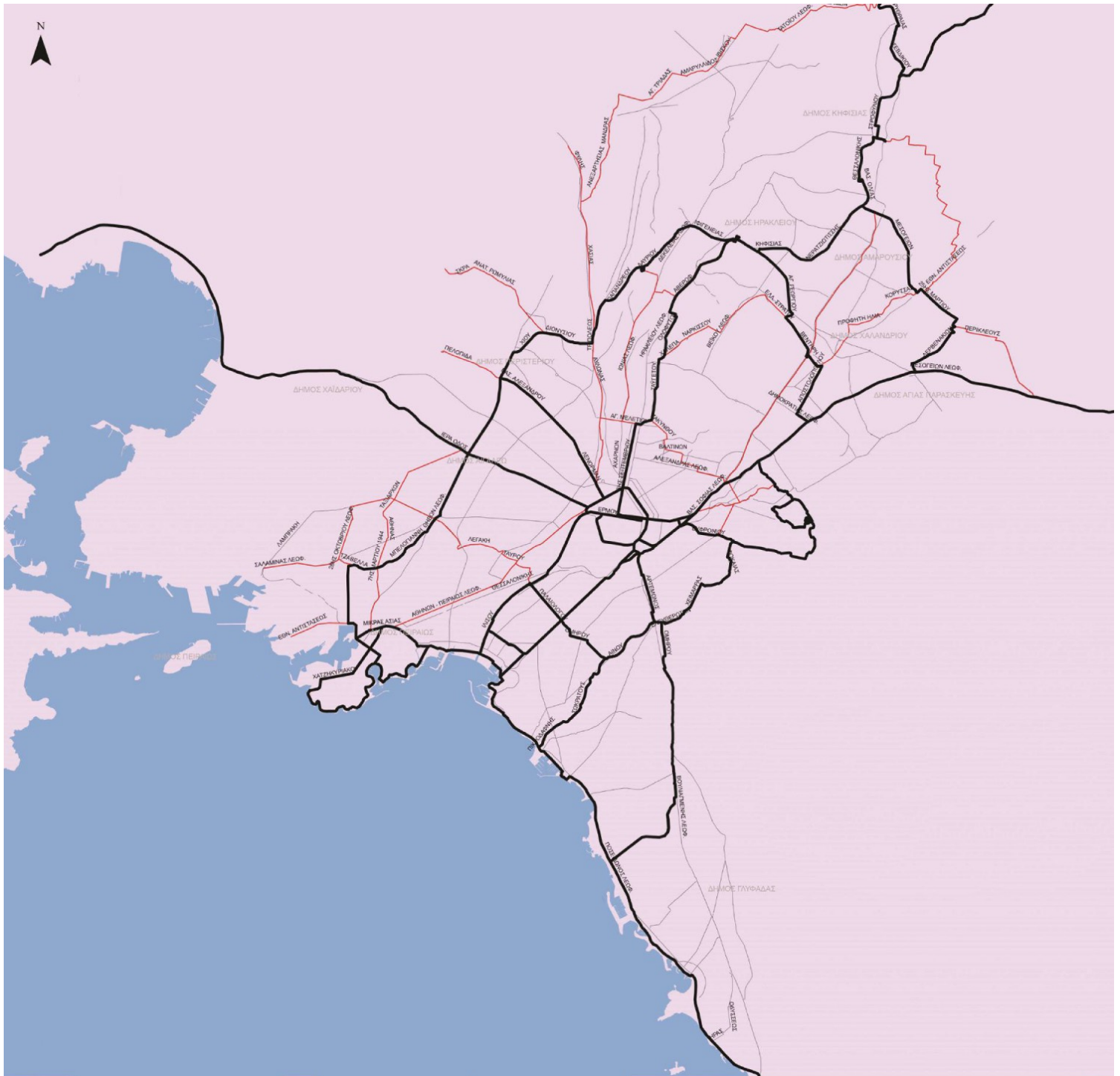
Εικόνα 3. Ποδηλατικοί άξονες (με μαύρο χρώμα) στο Ρυθμιστικό του 2014. Συμπεριλαμβάνονται δρόμοι όπως η Μεσογείων, η Λένορμαν, η Συγγρού κλπ.

Το πρώτο ζήτημα είναι η ανάγκη ενός συνολικότερου σχεδίου. Αντίστοιχες παρεμβάσεις με αυτές που πρόκειται να υλοποιηθούν στο κέντρο χρειάζεται να γίνουν σε όλες τις γειτονιές του Δήμου, αλλά και σε όλους τους Δήμους του Λεκανοπεδίου 5 . Προκειμένου να χρησιμοποιηθούν οι νέοι ποδηλατόδρομοι του κέντρου, είναι αναγκαίο να διευκολυνθεί η πρόσβαση των ποδηλάτων ως εκεί. Είναι απαραίτητο να δημιουργηθεί ένα δίκτυο μεγάλων ποδηλατικών αξόνων υπερτοπικού χαρακτήρα που ενώνουν δήμους και γειτονιές περνώντας από κεντρικούς δρόμους. Επισημαίνεται πως στο Ρυθμιστικό Σχέδιο του 2014 (Άρθρο 30, παράγραφος 6) προβλέπεται η θεσμοθέτηση μεγάλων ποδηλατικών διαδρομών 6 σε δρόμους όπως η Μεσογείων, η Λένορμαν, η Συγγρού κλπ. (Εικόνα 3). Είναι πλέον καιρός να πραγματοποιηθούν. Το ίδιο ισχύει και για την υλοποίηση του Βόρειου Ποδηλατικού Άξονα (που έχει μελετηθεί να ενώσει την Αθήνα με την Κηφισιά, κατά μήκος περίπου της γραμμής του τραίνου) η οποία εκκρεμεί ακόμα για διαδικαστικούς λόγους 7 .