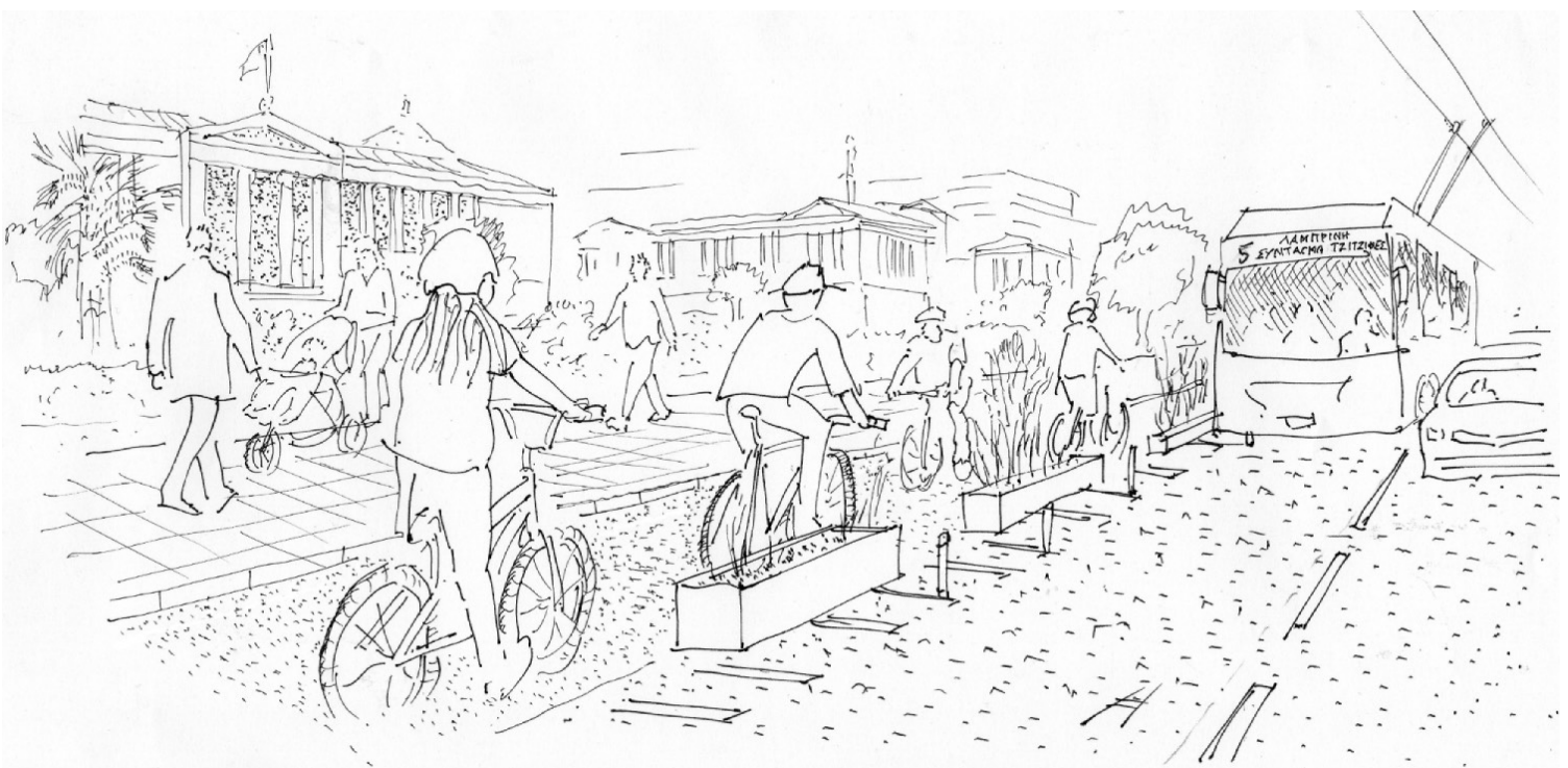
Εικόνα 2. Σκίτσο του λεωφορειόδρομου, του ποδηλατόδρομου και του διευρυνμένου πεζοδρομίου μπροστά στο Πανεπιστήμιο (σκίτσο Η.Π.).

Θα μπορούσε να γράψει κανείς πολλά ακόμα στοιχεία για τη συγκεκριμένη παρέμβαση και ακόμα περισσότερα για την αναγκαιότητά της 2 . Ίσως όμως θα ήταν πιο χρήσιμο να καταγραφούν ορισμένα ερωτηματικά σχετικά με το έργο ως προς πέντε βασικά ζητήματα 3 . Τα ερωτηματικά αυτά με κανέναν τρόπο δεν επιδιώκουν να υποβαθμίσουν την πρόταση, αλλά να την ενισχύσουν και να την προστατέψουν από αστοχίες που πιθανόν να δημιουργήσουν αρνητικές εντυπώσεις 4 .