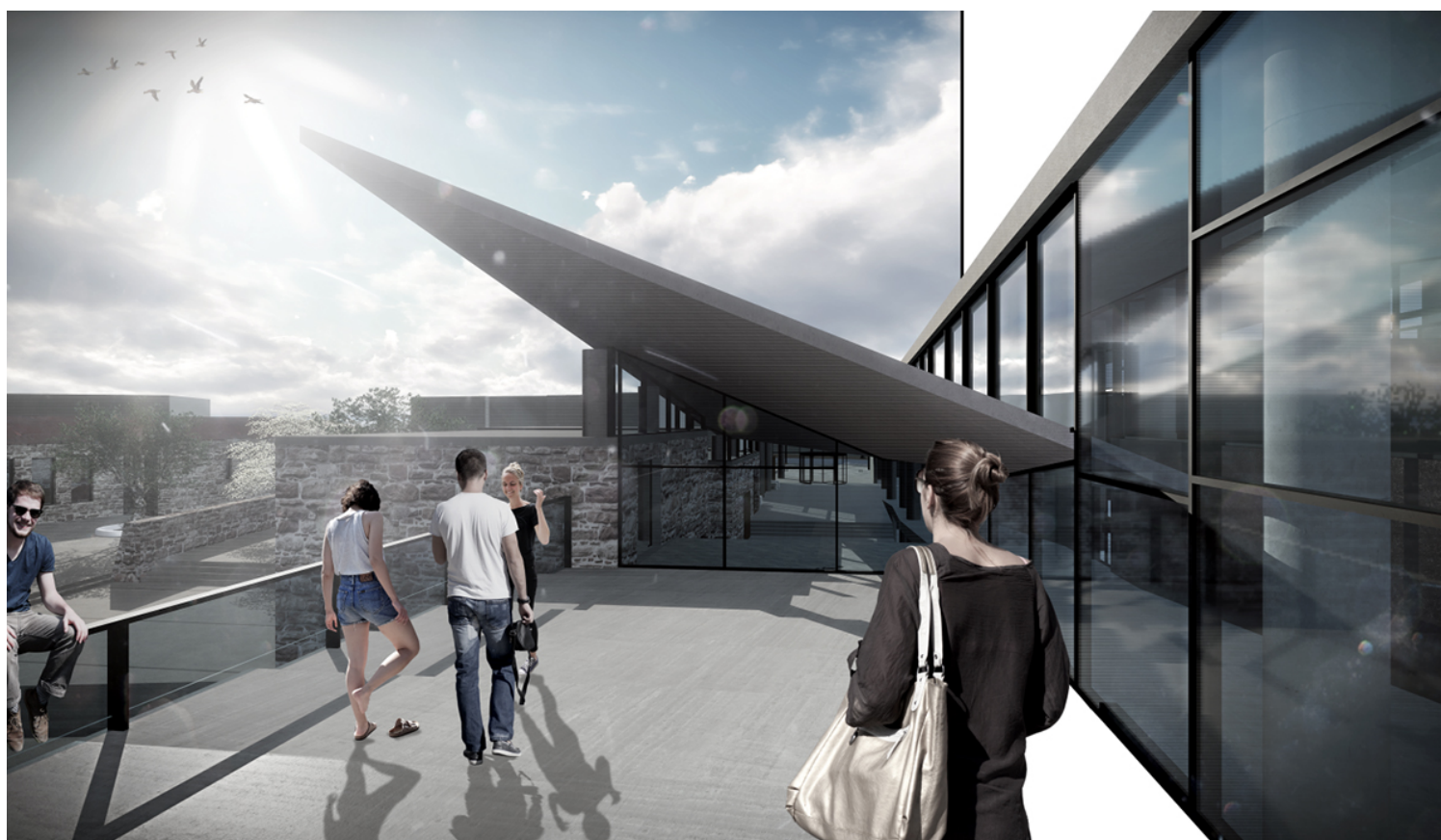
ΗΜΙΥΠΙΑΙΘΡΙΟΣ ΧΩΡΟΣ FOYER