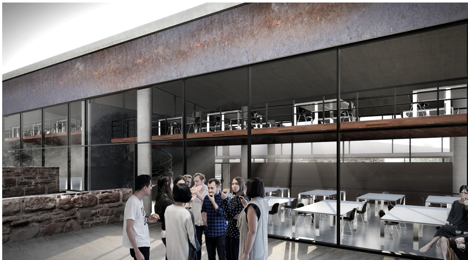
ΧΩΡΟΣ ΕΚΤΟΝΩΣΗΣ ΕΝΟΣ ΤΥΠΙΚΟΥ ΣΧΕΔΙΑΣΤΗΡΙΟΥ - STUDIO