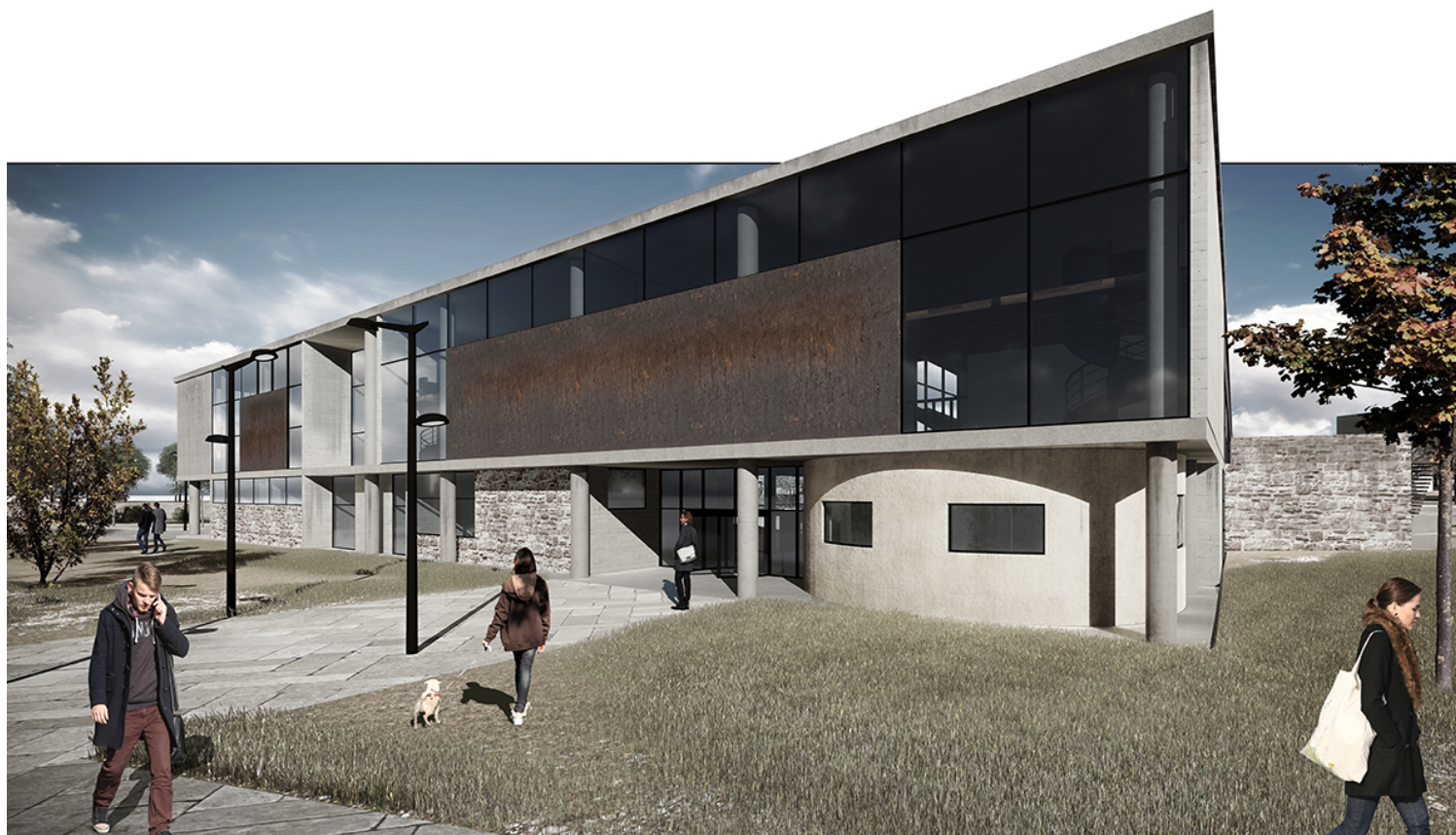
ΠΡΟΣΕΓΓΙΖΟΝΤΑΣ ΤΗΝ ΚΥΡΙΑ ΕΙΣΟΔΟ ΤΗΣ ΣΧΟΛΗΣ