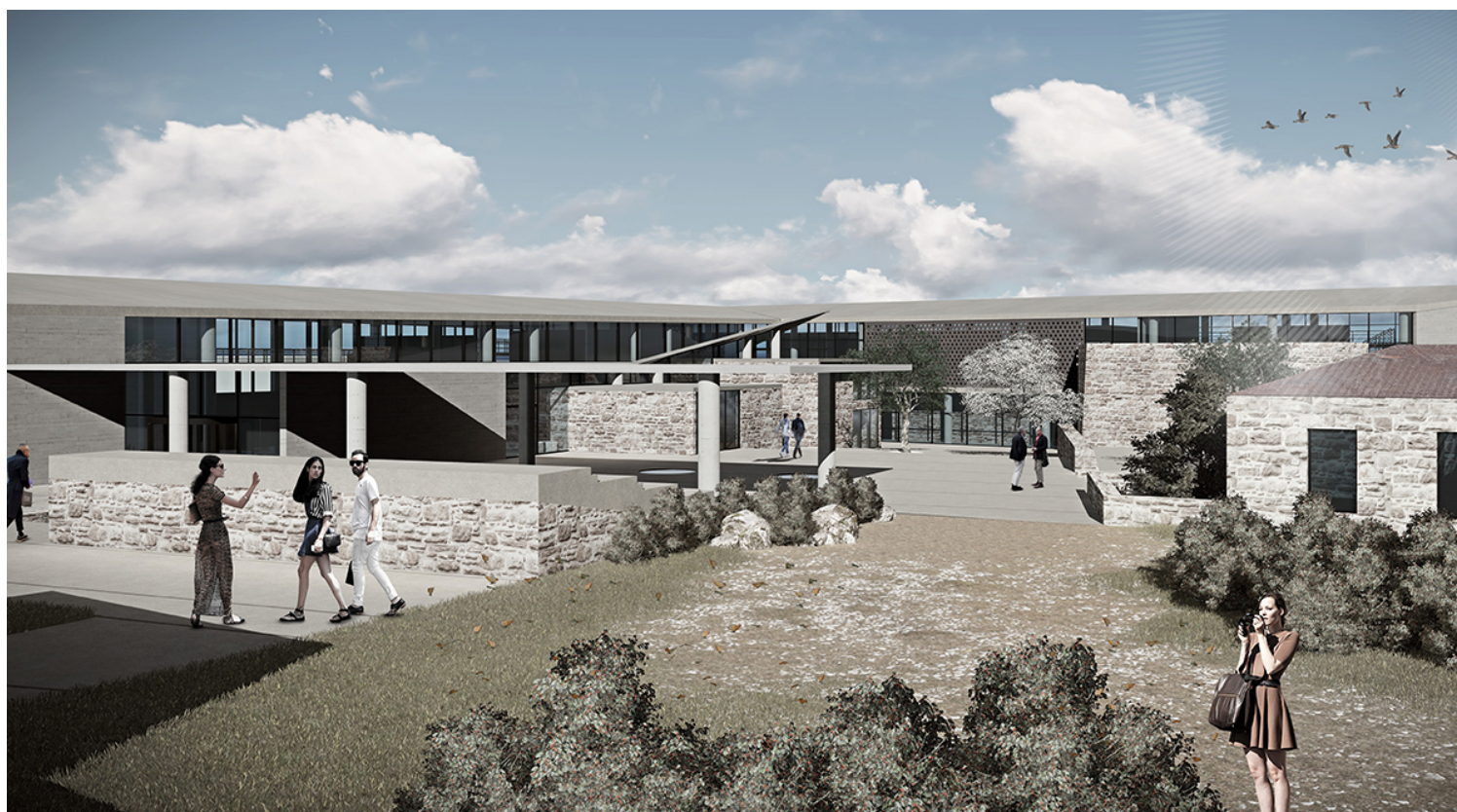
Ο ΥΠΑΙΘΡΙΟΣ ΧΩΡΟΣ ΤΗΣ ΣΧΟΛΗΣ