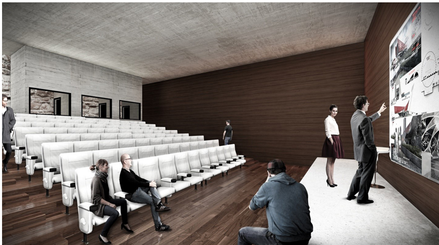
ΑΙΘΟΥΣΑ ΠΟΛΛΑΠΛΩΝ ΧΡΗΣΕΩΝ