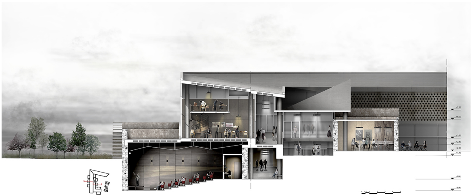
ΕΓΚΑΡΣΙΑ ΤΟΜΗ Z-Z