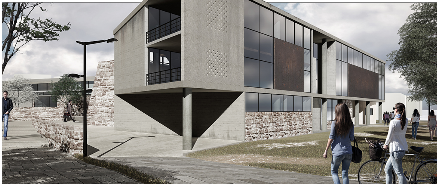
ΧΩΡΟΣ ΕΚΤΟΝΩΣΗΣ ΕΝΟΣ ΤΥΠΙΚΟΥ ΣΧΕΔΙΑΣΤΗΡΙΟΥ - STUDIO