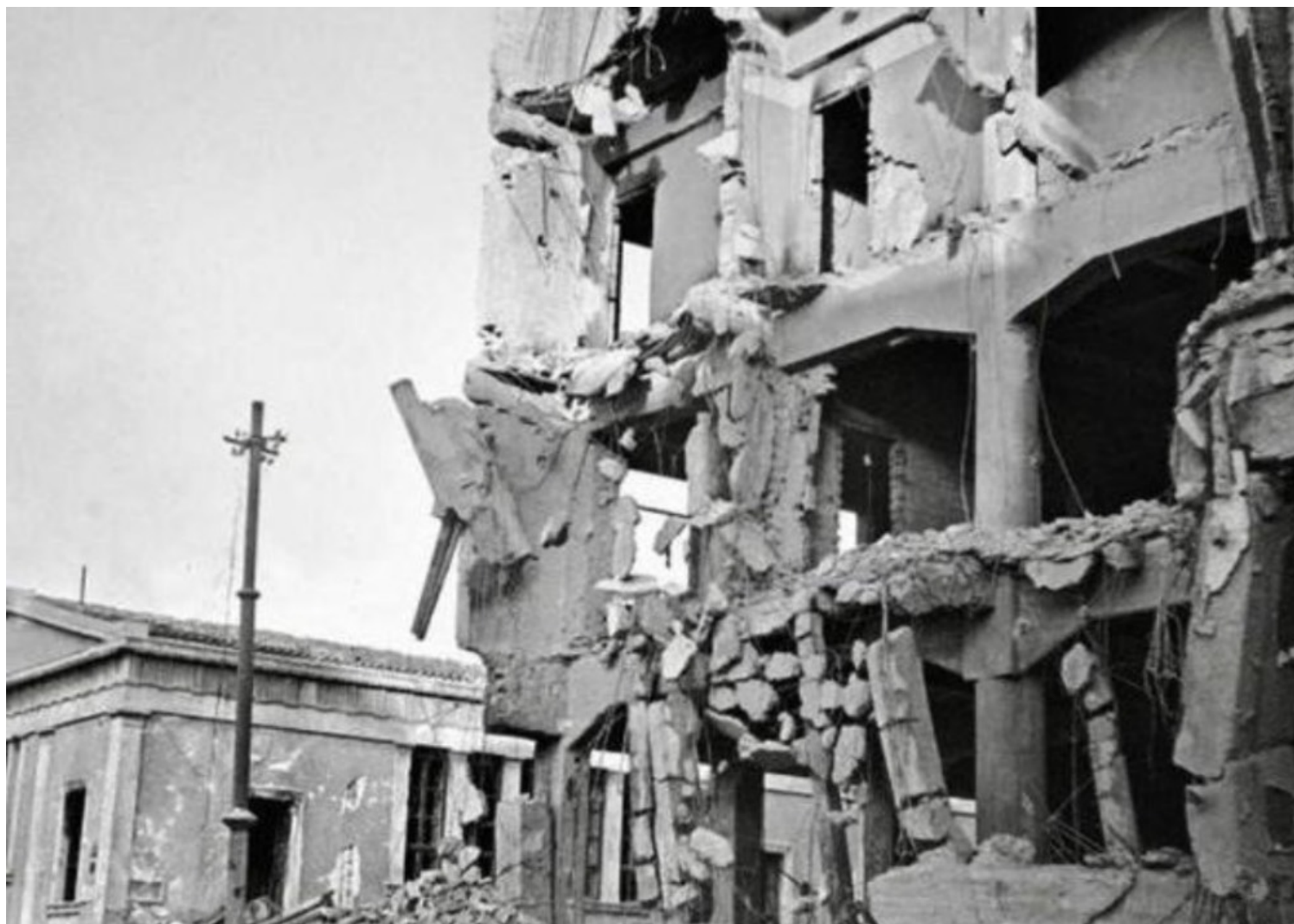
Εικόνα 4. Ιανουάριος 1945. Η ηγεσία του ΕΜΠ και, σε πρώτο πλάνο, το κατεστραμμένο από τις μάχες κτίριο της Γενικής Ασφάλειας