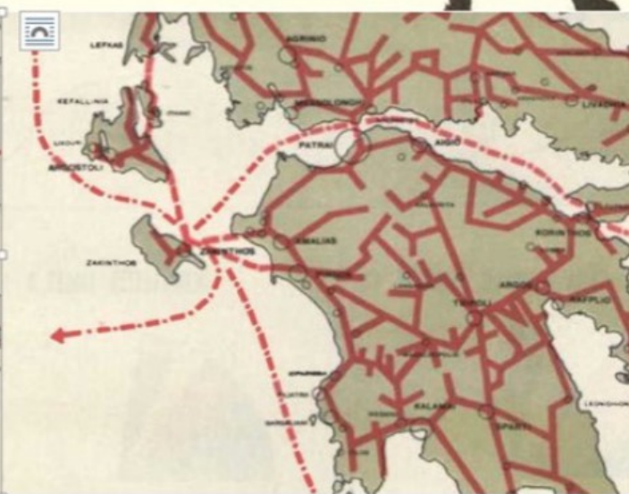
Εικόνα 5. Χάρτες που περιλαμβάνονταν στην στατιστική έκθεση των πολεμικών καταστροφών της Ελλάδας, την οποία επιμελήθηκε ο Κωνσταντίνος Α. Δοξιάδης