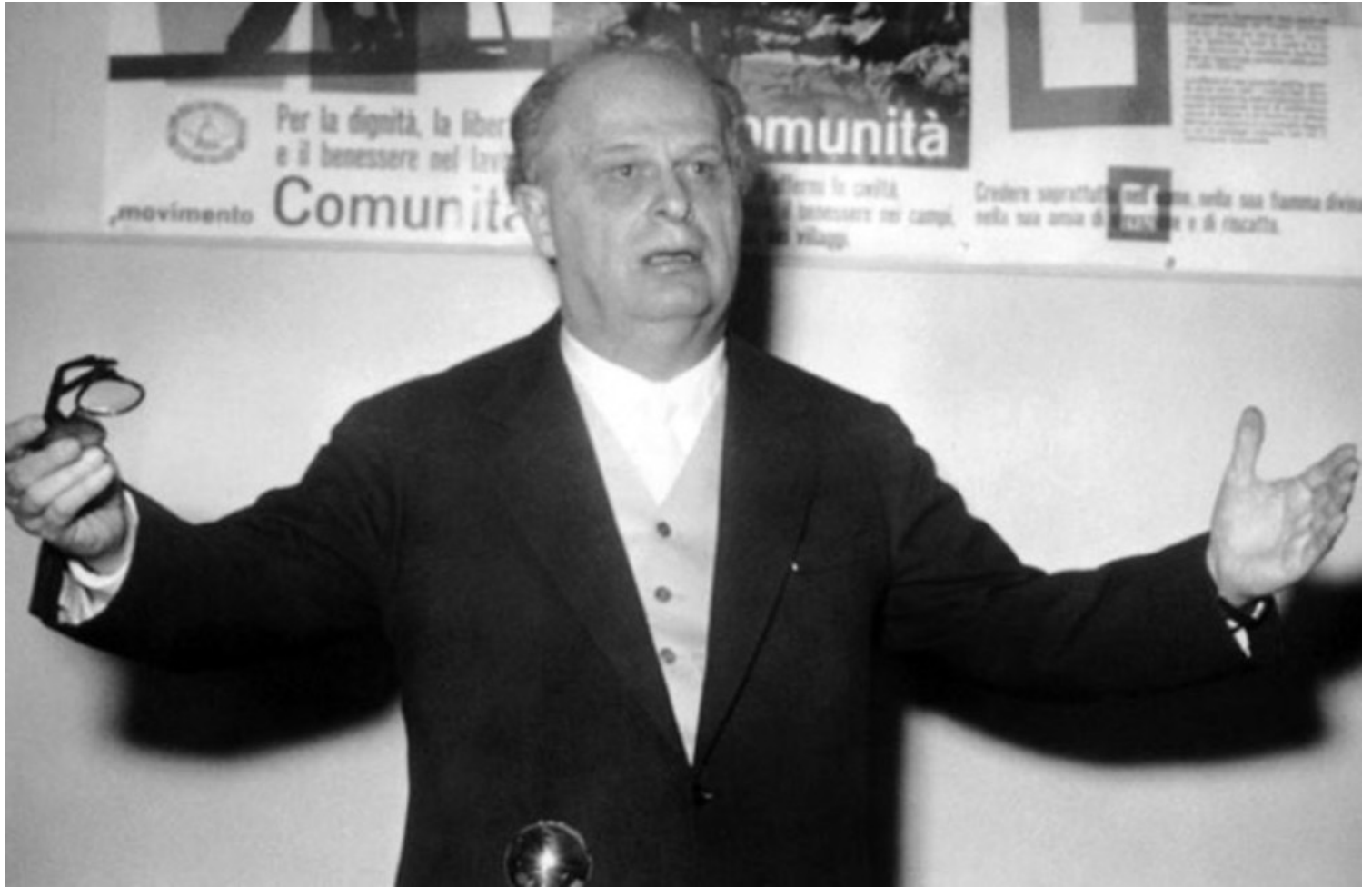
Εικόνα 1. Ο Adriano Olivetti